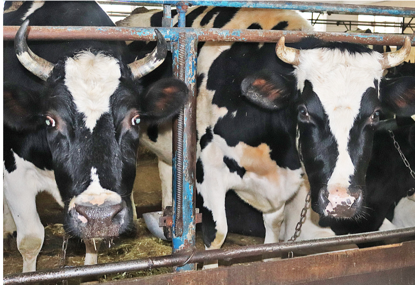
С каждым годом в АПК обостряется кадровая проблема, особенно в отрасли животноводства

По информации управления по развитию АПК Казанского района, посевная площадь в этом сезоне останется на уровне прошлого года и составит 78 985 гектаров. В настоящее время специалисты верстают планы посевов. О том, как они будут выглядеть в разрезе культур, экс-