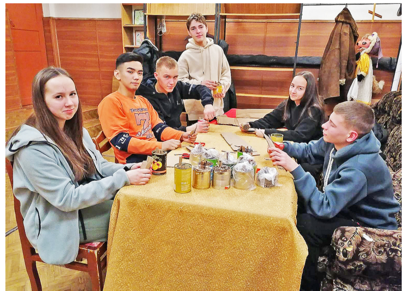
Активисты клуба «Патриот» ждут нового задания