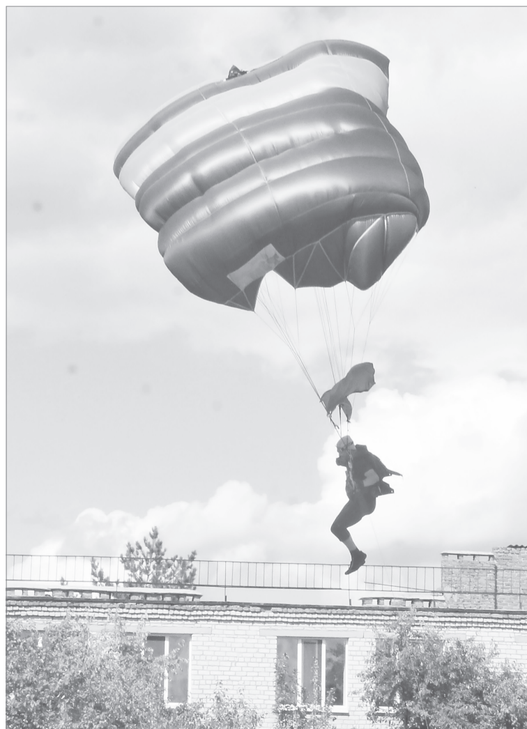
Посадка будет мягкой...