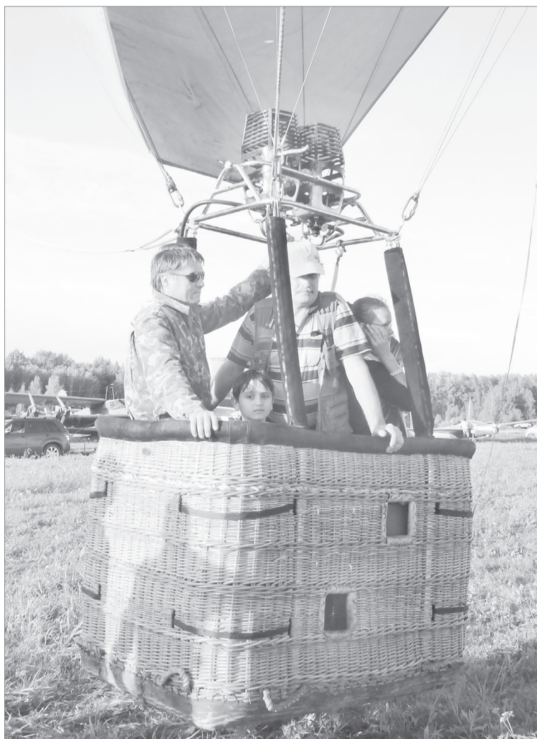
Небо для всех, жаль, корзина тесна