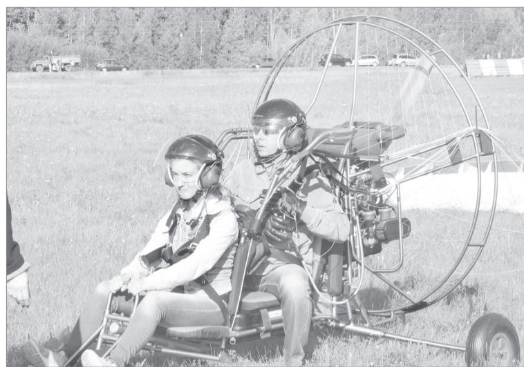
Паралётчики вернулись с четырёхсотметровой высоты!

- Ощущения потрясающие, - рассказывает он. - Это не то, чтобы в обычном аэробусе - здесь другое: чувствуешь, как ты на самом деле летишь над землёй. Видишь нашу рошу в форме звезды, собор, главные улицы, всё такое крохотное, и кажется - можно достать рукой... Профессиональный лётчик совершил несколько виражей, а в это время Александр в наушниках слушал