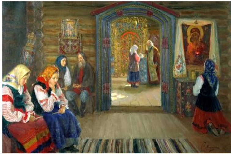
» Детская исповедь

Священнослужители говорят о том, что исповедоваться важно не только перед смертью, но и в течение всей жизни. Если