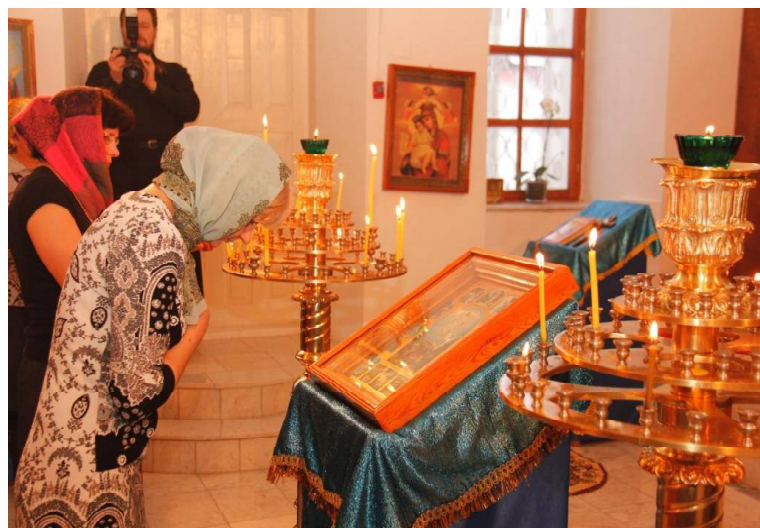
» В Викуловском храме

Вообще, к замечаниям в храме необходимо относиться с осторожностью. Порой человека приводят туда скорби, трудности. А тут вдруг кто-то пытается научить, вразумить, дать неуместные, ненужные в конкретное время советы. Священники на этот счёт придерживаются единого мнения: так делать нельзя.