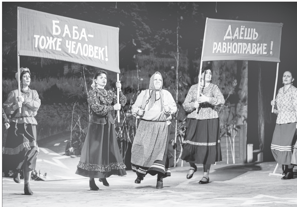
В постановке прозвучало немало отличных песен. Пришлось зрителям по душе и хореография