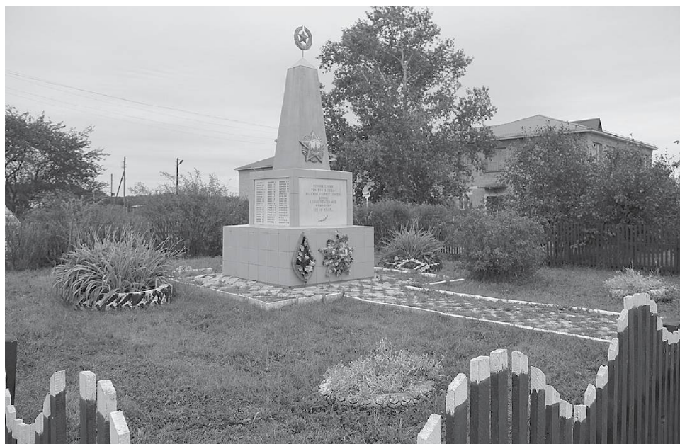
* Уход за памятником павшим – одно из направлений благоустройства.

Беседу вела Елена ДАНИЛЬЧЕНКО