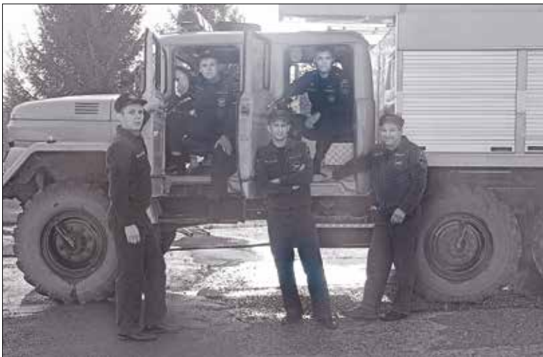
Голышмановские пожарные – серебряные призёры региональных соревнований

Голышмановские пожарные 110-й пожарно-спасательной части 27-го ОФПС по Тюменской области стали серебряными призёрами региональных соревнований среди звеньев газодымозащитной службы.