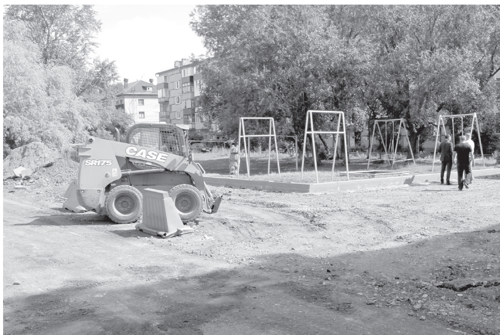
Благоустройство двора по ул. Еришова, 87 идет быстрыми темпами. Уже установлены бордюры, выровнено основание под асфальт. Подрядчик обещает завершить работы в течение недели.

– На этот год было подано более десяти заявок, но в связи с ограниченным финансированием выбрали наиболее заселенные территории, а также те, где ранее проводились работы по замене или ремонту инженерных коммуникаций, чтобы завершить благоустройство. Средства на реализацию программы выделяются из областного бюджета, муниципалитет перечисляет их управляющей компании, которая проводит конкурс по выбору подрядчика. Все подрядчики, как правило – местные организации или предприниматели, – рассказал директор департамента