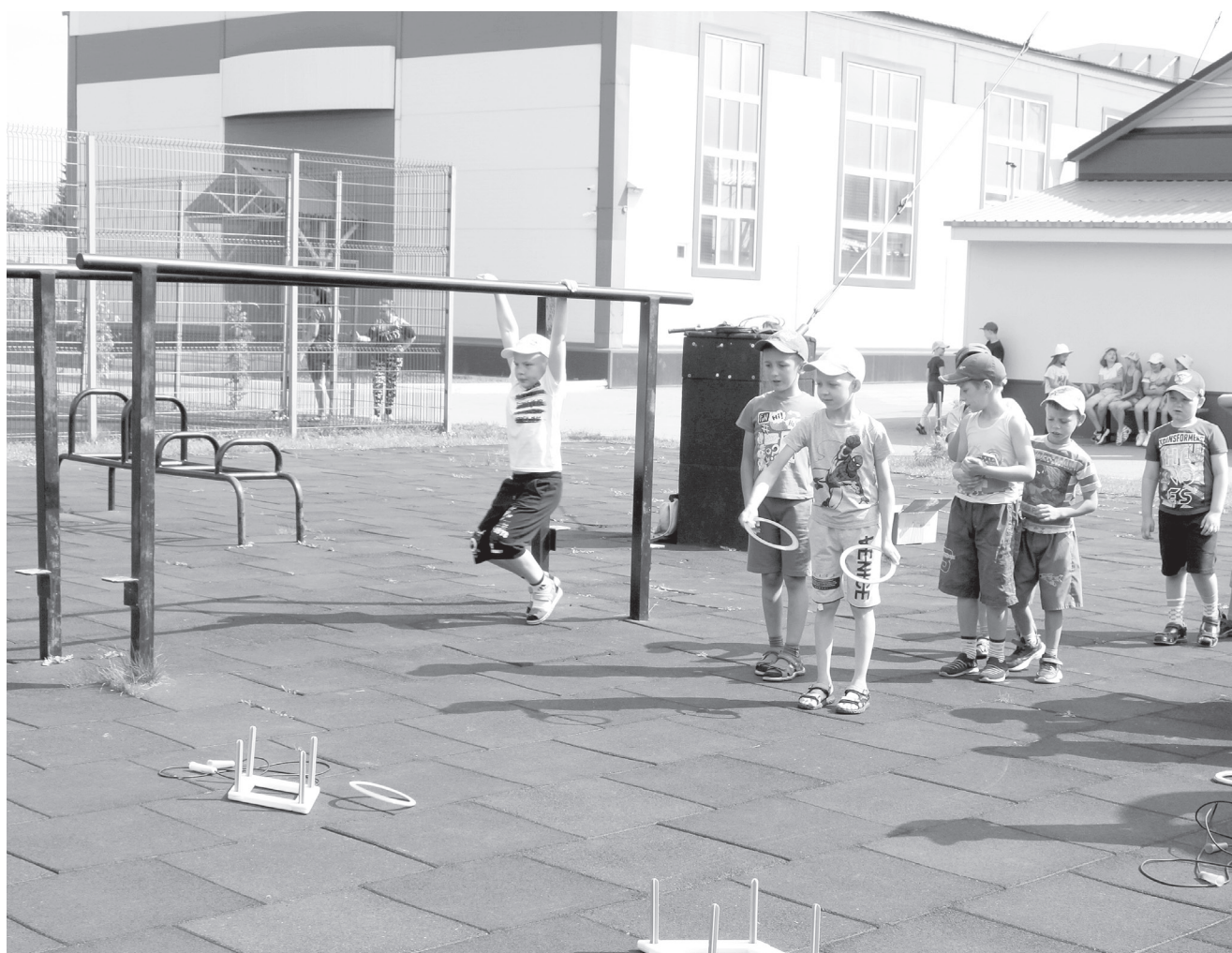
В хорошую погоду большинство мероприятий в пришкольном лагере проводят на свежем воздухе.

Весело, задорно и активно проходят каникулы у юных ишимцев.