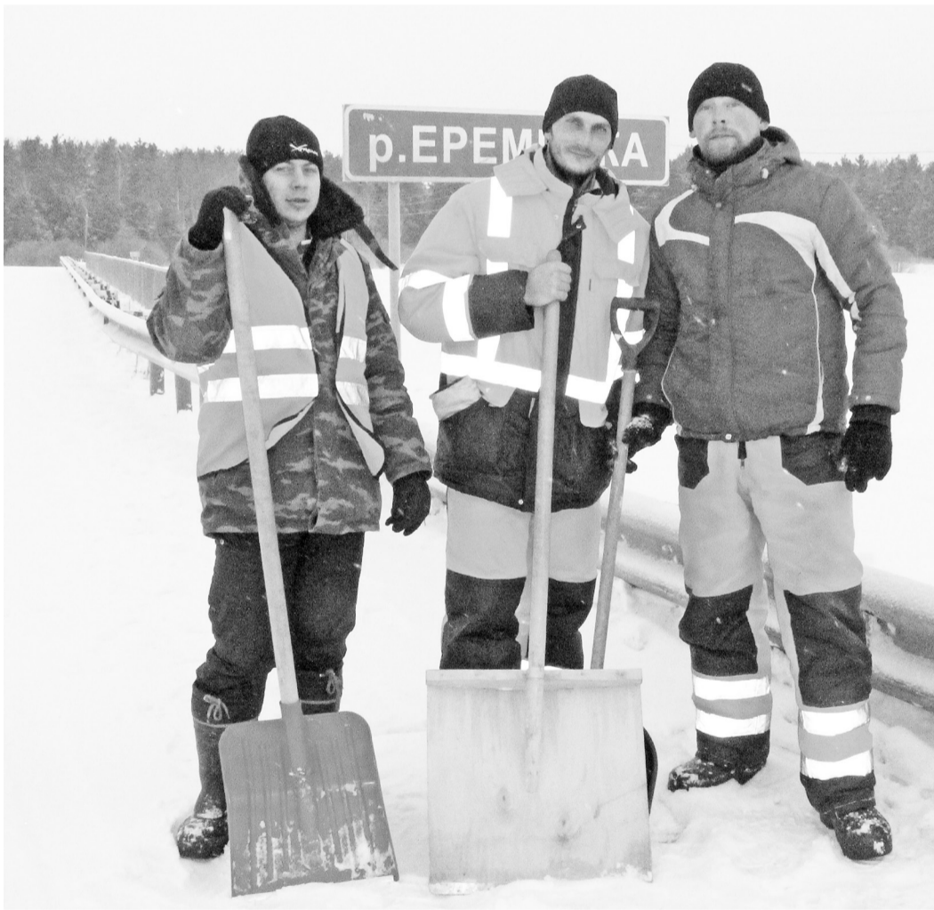
Ребятам, экипированным по всей форме, не страшны даже сильные морозы. Их задача – произвести очистку проезжей части моста, полос безопасности, барьерных ограждений и световозвращающих элементов.