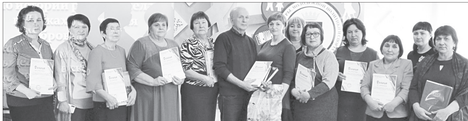
В конкурсе проектов об истории родного села участвовали пятьдесят селян, десять из них вышли в финал

Фестиваль добровольцев и волонтеров стал ключевым в цикле проектов и в очередной раз доказал масштабность и активность добровольческого движения на территории Ялуторовского района. ①