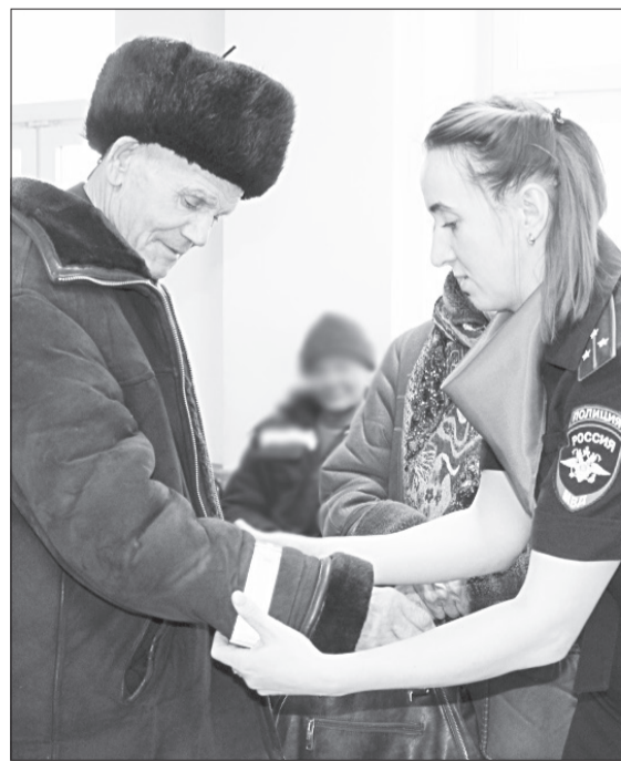
Изготовленные на мастер-классе световозвращатели раздали пассажирам автовокзала

Автоинспекторы вручили пассажирам листовки с призывом стать заметнее на дороге и разместили в здании автовокзала плакаты, рассказывающие о правилах использования световозвращающих элементов.