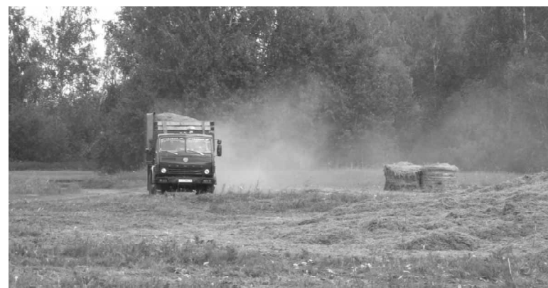
На отвозе зеленой массы в сельхозпредприятии заняты десять машин