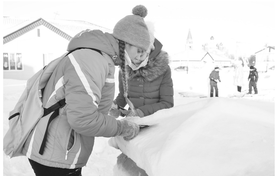
Ещё немного времени – и снежный теремок будет «построен».

го атрибута праздник-не праздник. Ученики дружно наряжали лесную красавицу, да не простыми игрушками, а самодельными. Но такими... Сделанные с душой и сердцем, с теплотой и фантазией они сразу же привлекают внимание. Тут и сказочные домики, и гигантские конфеты, и необычные гирлянды.