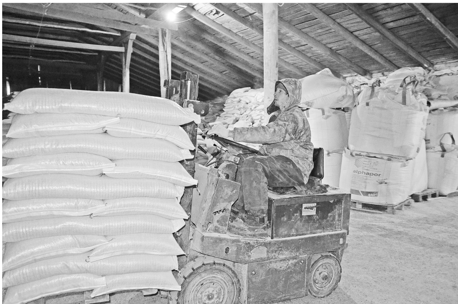
Очередные тонны комбикорма отправляются в г.Тобольск.

Люди старшего поколения помнят, каких трудов, непонятных связей стоила покупка мешка-другого комбикорма для содержащегося на подворье скота. Здесь уже было не до выбора – пшеничная так пшеничная дроблёнка, с примесью овса, ячменя, гороха – совсем отлично. Оно и сегодня примерно так в наших хозяйствах происходит.