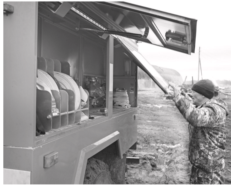
Моменты подготовки к противопожарным мероприятиям.