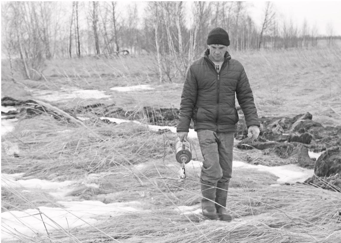
Рабочие авиабазы проводят профилактические отжики.