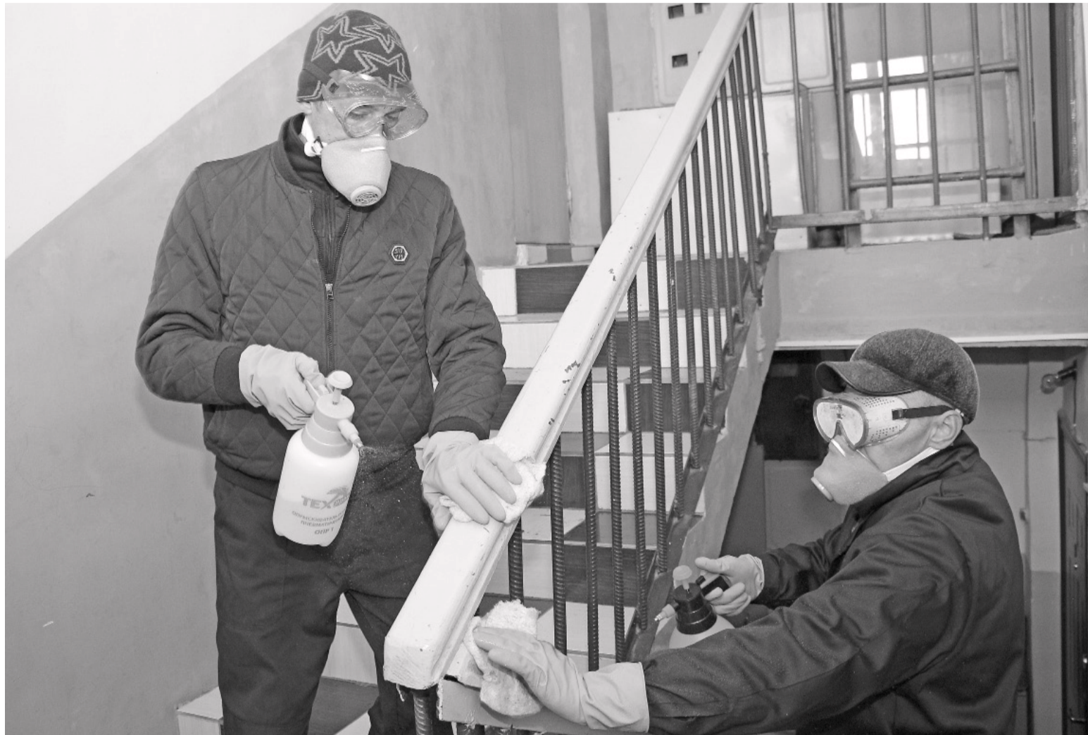
Коммунальщики обрабатывают раствором помещения общего пользования.