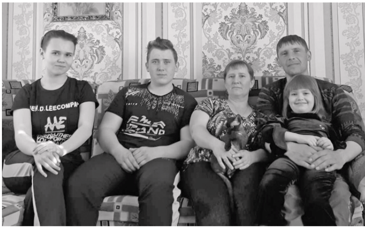
Самоизоляция – повод побыть всем вместе.

Режим самоизоляции подразумевает постоянное нахождение дома. Выходить можно только по крайней