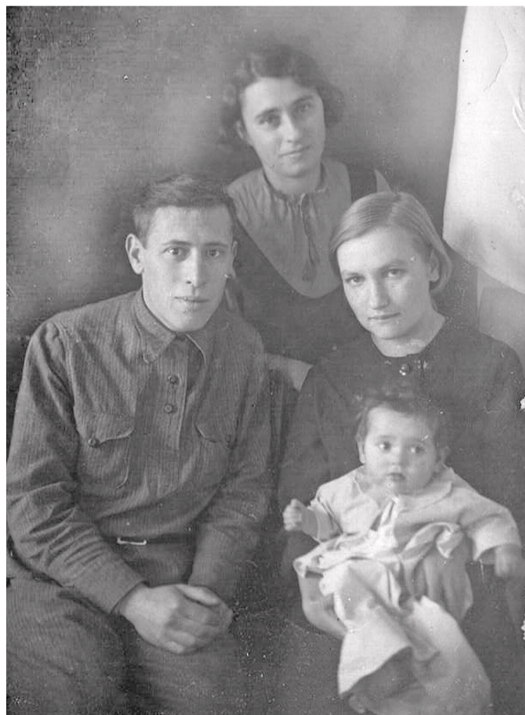
Фотография от 25 января 1942 года стала последней семейной фотографией Мауриных.

Анастасия ГАЦАЕВА