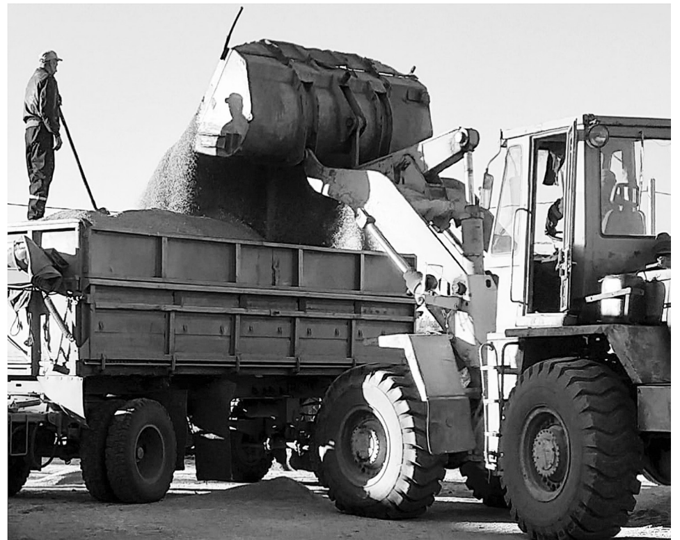
Инновации в растениеводстве приносят свои плоды

«31 октября – исторический день, закончили посевной год. Этот рабочий цикл завершили. Теперь будет время для подведения итогов и время для проведения анализа. Зимой будем проводить работу над ошибками, анализировать, что мож-