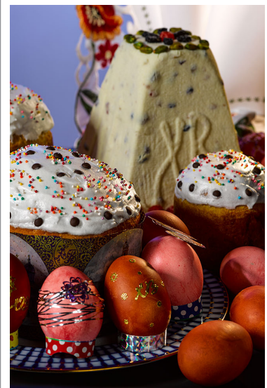
Традиционные пасхальные угощения.

Девочки почерпнули много нового и интересного из православной культуры.