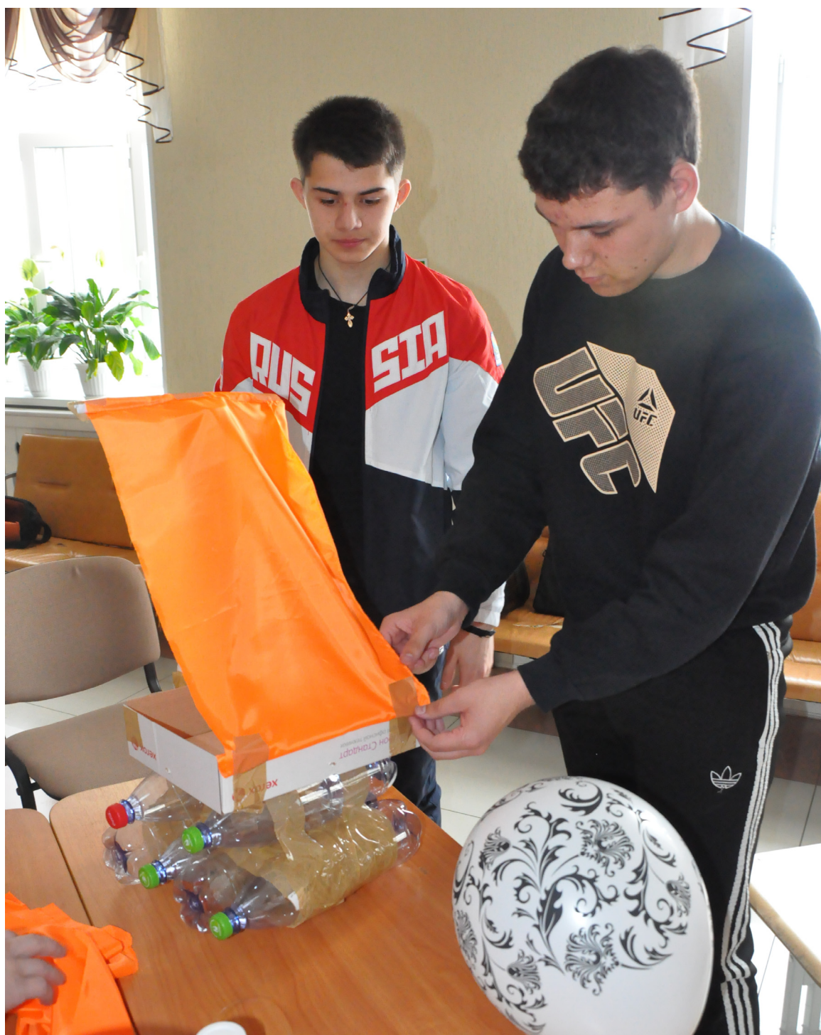
Шороховские школьники – победители инженерных соревнований.