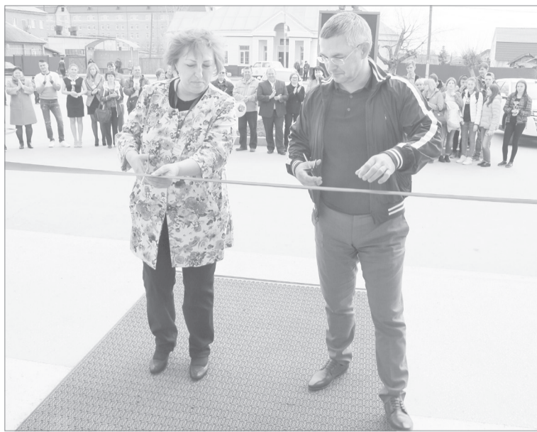
Ещё секунда и «День застройщика» открыт