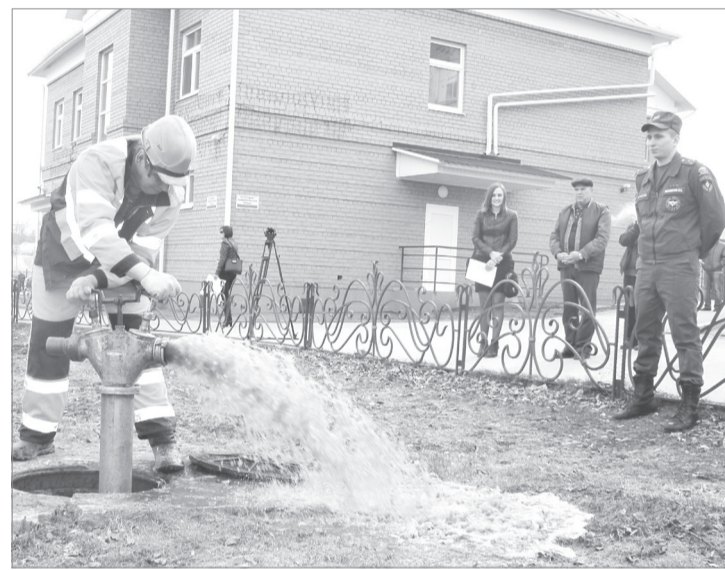
Сотрудники «Горводоканала» и пожарной части проверяют работу пожарного гидранта