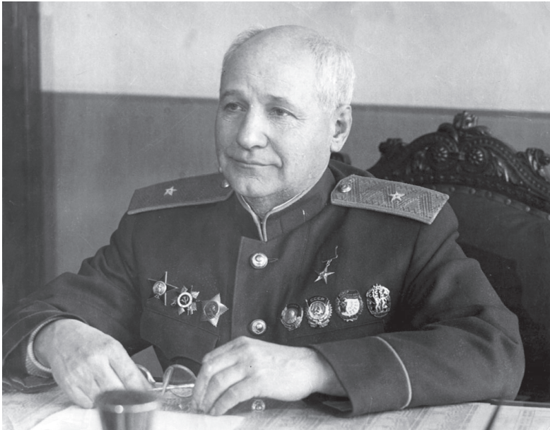
Андрей Николаевич Туполев