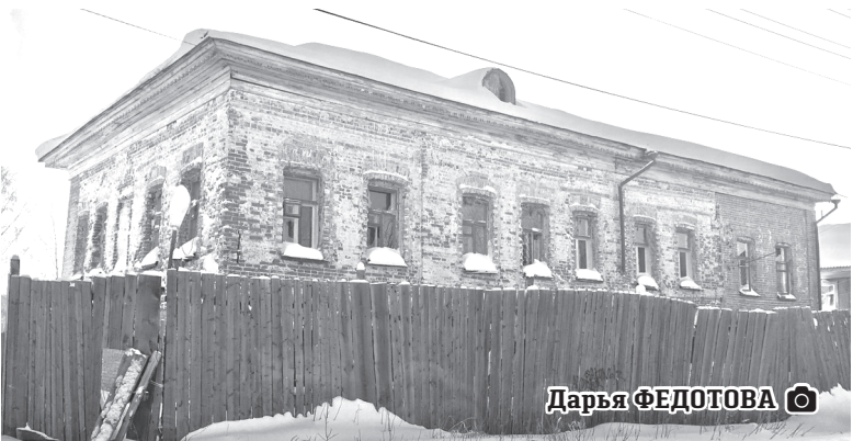
Сегодняшний вид дома Туполевых на ул. Мира