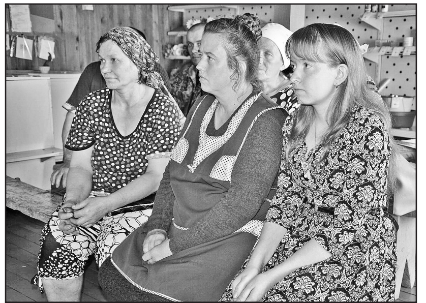
На встречу с главой района пришли самые активные жители деревни