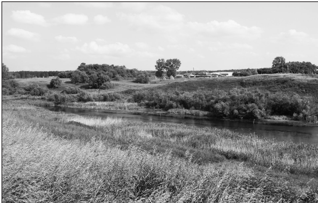
МИЛЫЙ СЕРДЦУ УГОЛОК