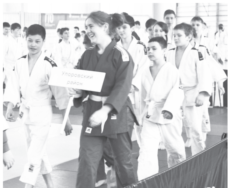
Упоровская команда дзюдоистов к честной борьбе готова.