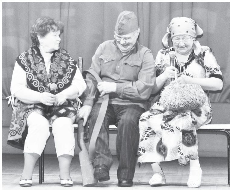
Победители в номинации «Оригинальный жанр» – сценка «Про Федота» (Ингалинское поселение).

цертные номера. Конкурсанты выступали в разных номинациях по своему выбору, кто-то в «Вокале», кто-то в «Художественном слове», кто-то в «Декоративно-прикладном творчестве и ИЗО», а кто-то в «Оригинальном жанре». Надо отметить, что все участники были на высоте. На мой взгляд, самыми яркими, запоминающимися стали выступления артистов в сценках «Салон красоты» (Нижнеманай-