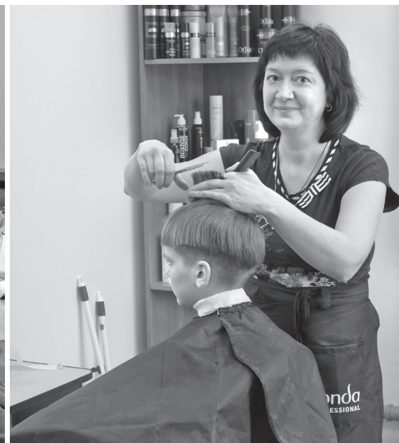
• В салоне красоты «Очарование» к каждому клиенту индивидуальный подход.