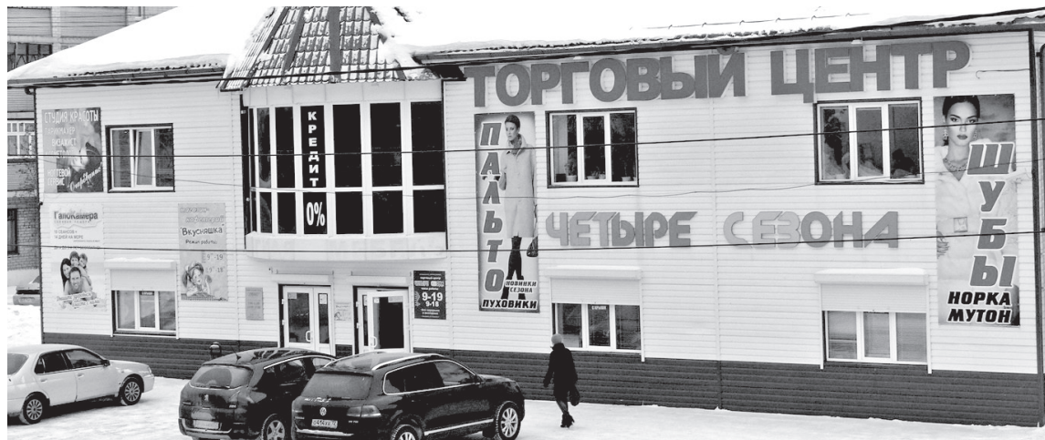
• Торговый центр «Четыре сезона» по адресу: г. Заводоуковск, ул. Глазуновская, 9 работает без перерывов и выходных с 9.00 до 19.00 в будние дни, а в субботу и воскресенье – с 9.00 до 18.00. Телефон для справок 2-29-19.

Алла ЕГОРЫЧЕВА Фото автора (На правах рекламы)