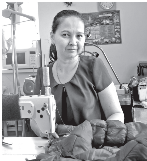
• В швейном ателье всегда можно отремонтировать одежду или подогнать её по размеру.