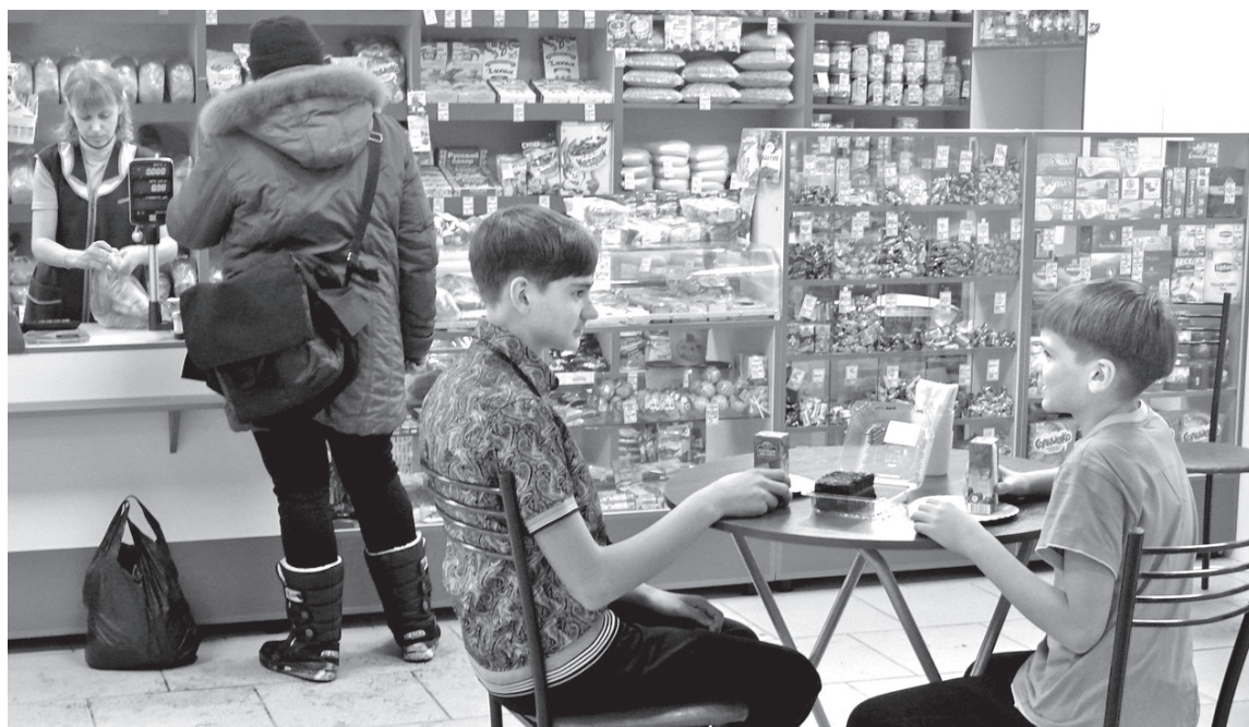
• В кафетерии «Вкусняшка» можно не только перекусить, но и купить свежую выпечку и разнообразные продукты к домашнему столу.