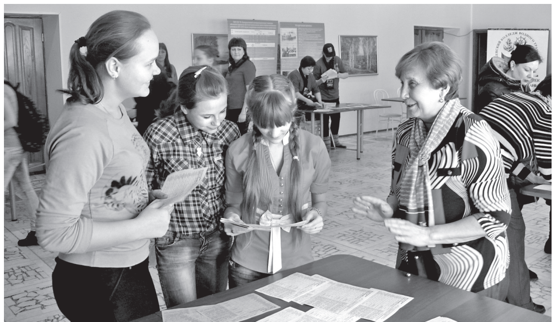
• Тюменский колледж экономики, управления и права заинтересовал в основном старшеклассниц.