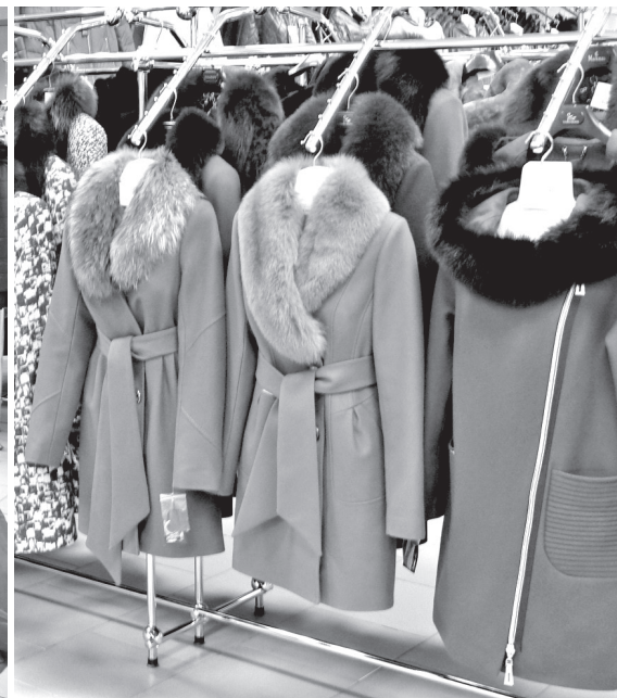
• В торговом центре большой выбор мужской и женской верхней одежды российского производства.