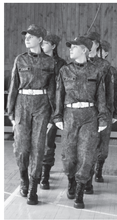
Ровным строем девушки прошли, исполняя песню