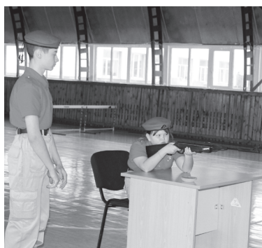
Проверка на меткость

Было интересно наблюдать за тем, как нежные девичьи руки снимают составные части оружия, видеть интерес в глазах участниц, достойный посоревноваться с мужским. С какой точностью курсантки попадали