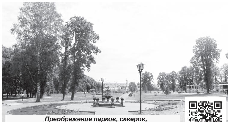
Преображение парков, скверов, дворовых территорий идёт без остановки и в городах, и в районах

У каждой семьи свой уникальный дух. У Тюмени – дух творческий, новаторский, предпринимательский. Именно этот неукротимый дух созидателей, строителей, первооткрывателей передаётся на нашей земле от поколения к поколению, и именно он ведёт нас вперёд. Проактивность – слово, указывающее на ту же традицию. Бывают исторические периоды, когда традиции оживают, обновляются, обретают новую силу. Такое время выпало и нам. Не сомневаюсь: тюмен-