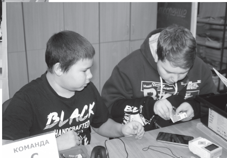
Всё согласно инструкции