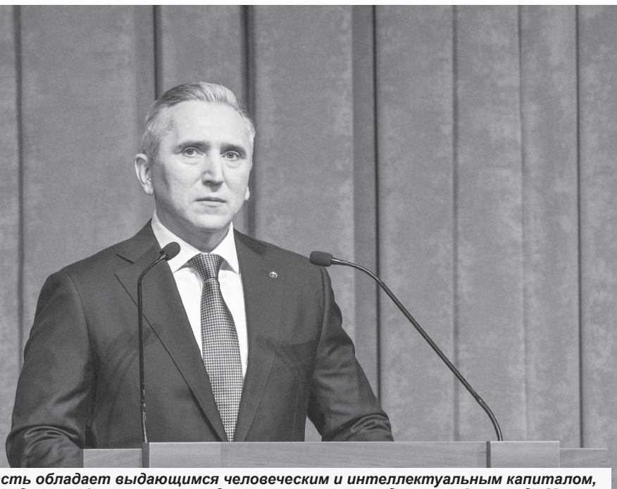
Тюменская область обладает выдающимся человеческим и интеллектуальным капиталом, значительными демографическими и трудовыми ресурсами, подчеркнул Александр Моор

Тем более что инновациями охвачена не только экономика в узком смысле слова, но и все сферы нашей жизни, нашего, как правильно говорили раньше, народного хозяйства и быта. Тюменская область – большая стартовая площадка. И стартуют наши проекты в будущее.