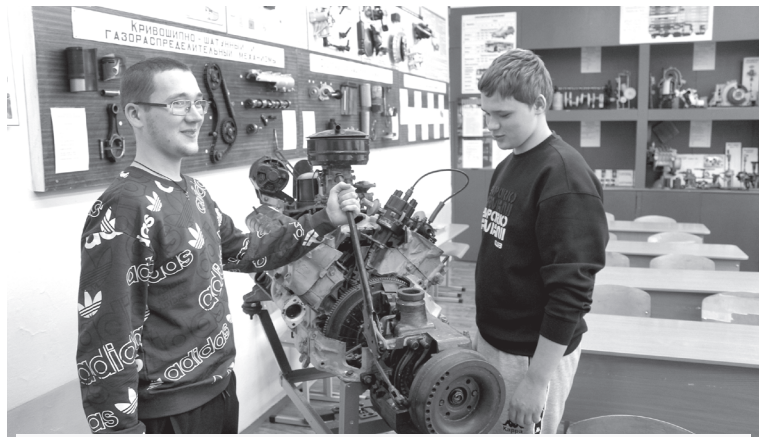
Сконцентрировать фокус на среднем профессиональном образовании призвал глава региона

Мы будем и дальше делать всё, что в наших силах, чтобы поддержать ребят, защищающих в зоне специальной военной операции интересы России, наши с вами. Бойцы должны быть уверены: земляки ими гордятся, ждут дома с победой!