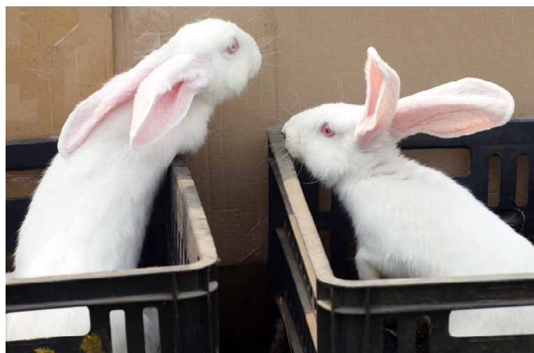
Кролики - это не только ценный мех