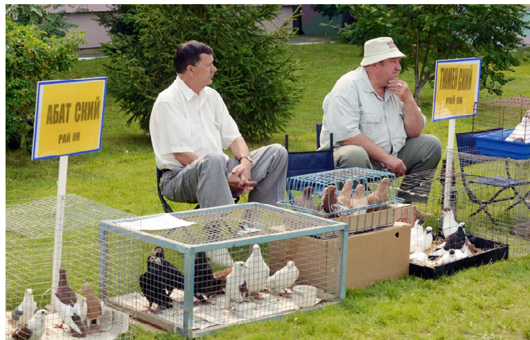
Разведение голубей - чисто мужское увлечение

Омутинцы и приехавшие к нам гости были приятно удивлены выставке голубей и декоративной птицы, устроенной любителями птицеводства Тюменского края. В этом интересном для людей любого возраста мероприятии участвовало 25 голубеводов и птицеводов из 8 районов юга Тюменской области, которые представили перед зрителями праздника более двадцати пород голубей, а также 15 пород приусадебной и декоративной птицы. Были здесь даже золотистые фазаны! Матушка-природа постаралась, создавая золотого фазана столь великолепной раскраски, которого трудно спутать с другим подвидом. Золотой фазан родом из Китая, он очень красив, в его перьевом покрове удивительным образом сочета-