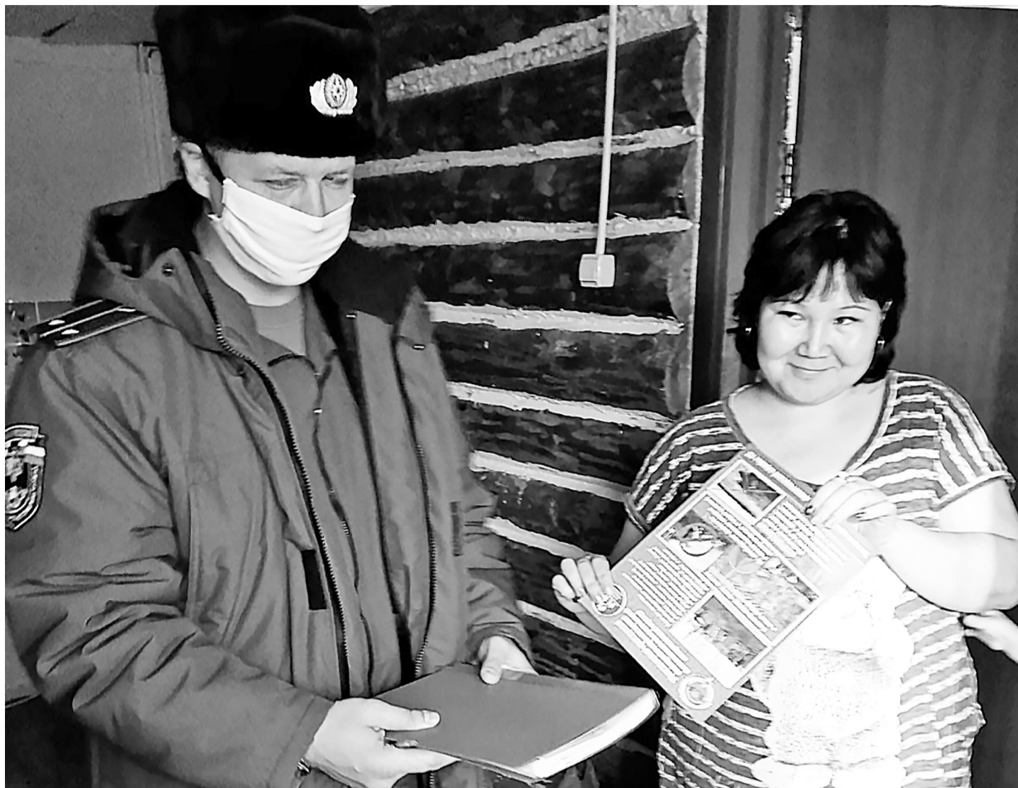
Видите, дом деревянный, и совсем нелишне, что пришёл инспектор, указал на слабые места и оставил памятку по противопожарной безопасности.

Весь октябрь в Нижнетавдинском районе осуществляются межведомственные рейды противопожарной направленности