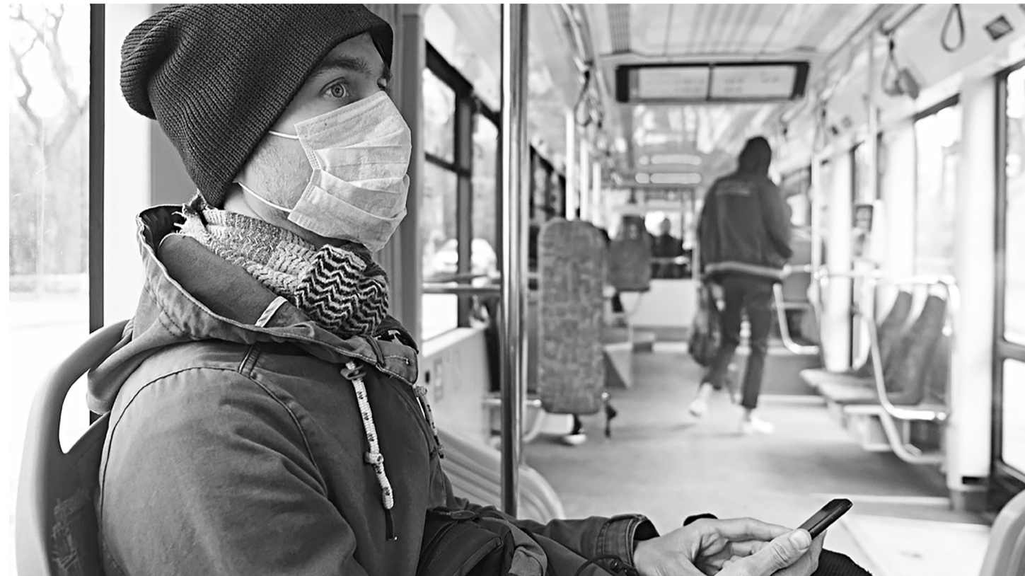
В общественном транспорте повышена опасность заражения респираторными инфекциями, поэтому обязательно носите маски. Это, по данным сайта стопкоронавирус.рф, в 1,5-2 раза снижает вероятность передачи вирусов.

В Тюменской области ежедневно увеличивается число заболевших COVID-19