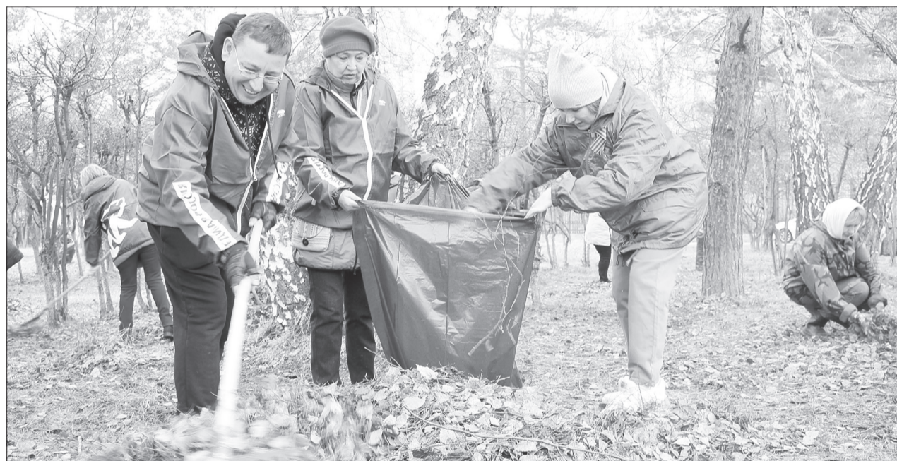
Депутатский корпус ежегодно наводит порядок в скверике перед центральным входом в рошу Декабристов