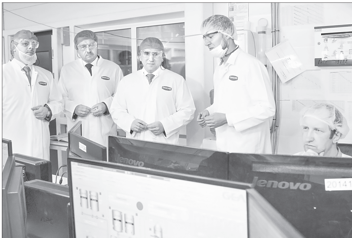
Сегодня филиал «Молочный комбинат «ЯЛУТОРОВСКИЙ» - одно из крупнейших предприятий в стране, мощность которого - до 1000 тонн переработки молока в сутки

■ ОБЪЕМ ИНВЕСТИЦИЙ. 485 млн рублей в реконструкцию цеха сушки.