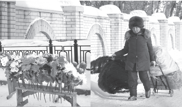
«Нелегалы» удобно расположились и на территории у Завального кладбища