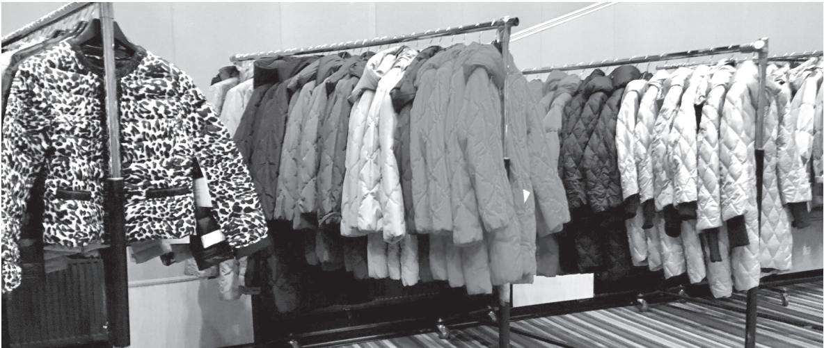
Верхняя одежда, купленная у «передвижников», часто не держит тепло

делённым стандартам качества и безопасности) стоят 25 тысяч, а на уличной точке – 18 и меньше без сертификата. Предпринимателю надо платить налоги, страховые взносы, выплачивать работникам зарплату, при этом один сертификат на год, к примеру, на носовые платки стоит 25 тысяч рублей... Конечно, предприниматель, работающий по закону, терпит убытки. Не секрет, что во многих городах России, в том числе в Тобольске, бизнес в части торговли закрывается, пер-