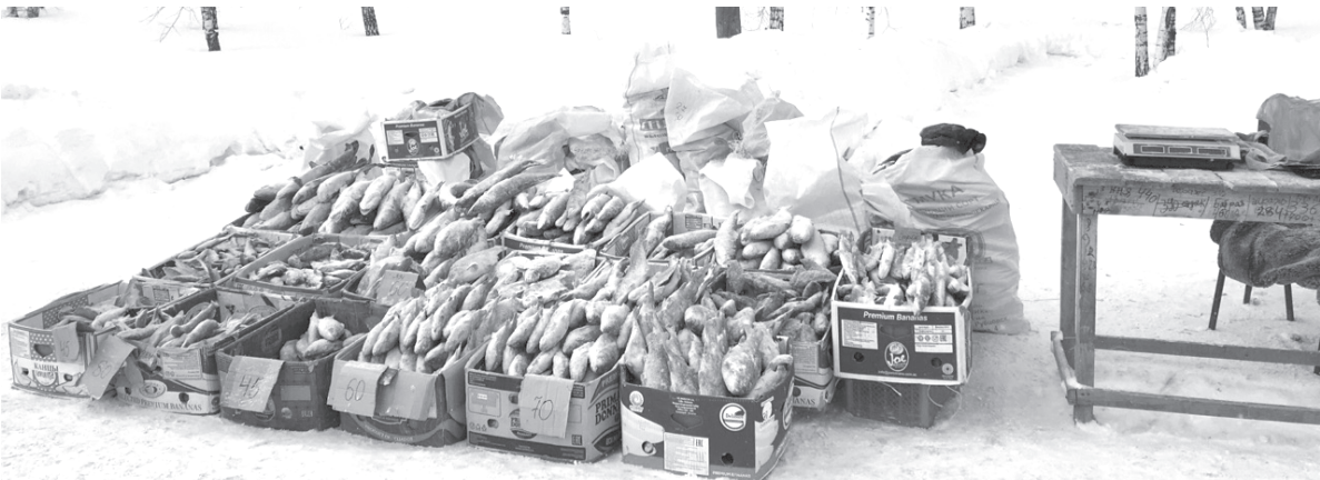
Одна из постоянных точек стихийной торговли – на улице Знаменского

Зампрокурора выразил готовность подключиться к работе и по другим городским объектам, особенно на Завальном кладбище, и устраивать рейды с полицией 2-3 раза в неделю, как на Червишевском кладбище или на Тюменском центральном рынке, где торговцы заполнили территории перед этими объектами. По поводу торговых выставок – нужны обращения граждан, и будет проверено наличие сертификатов, медкнижек продавцов и документов на право предпринимательской деятельности. «И собственников объектов, где останавливаются ярмарки с товарами сомнительного качества, тоже предупредим», – заметил Денис Ко-