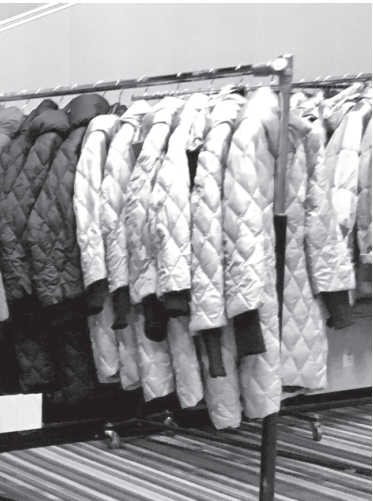
Верхняя одежда, купленная у «передвижников», часто не держит тепло

– При проведении рейдов нам сложно составить протокол, так как у нарушителей часто нет документов, удостоверяющих их личность, – пояснил глава комитета экономики. Да и нет у представителей администрации полномочий на более жёсткие