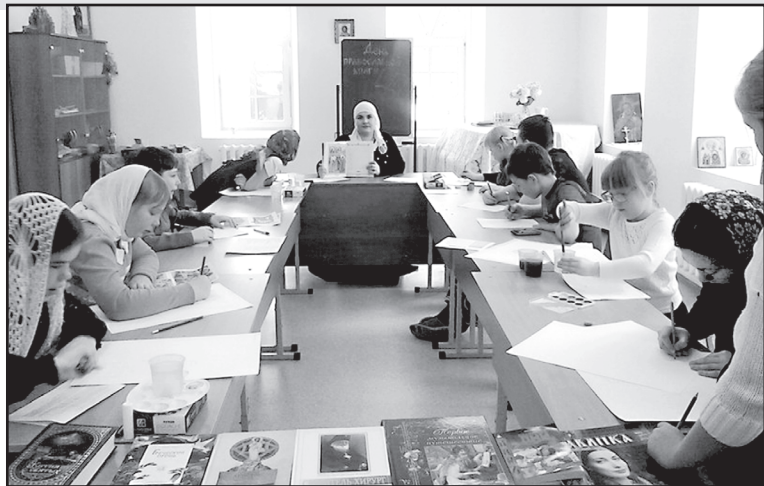
На уроке в воскресной школе при храме Святой Троицы

– Без пения не проходит ни одна служба в храме, –