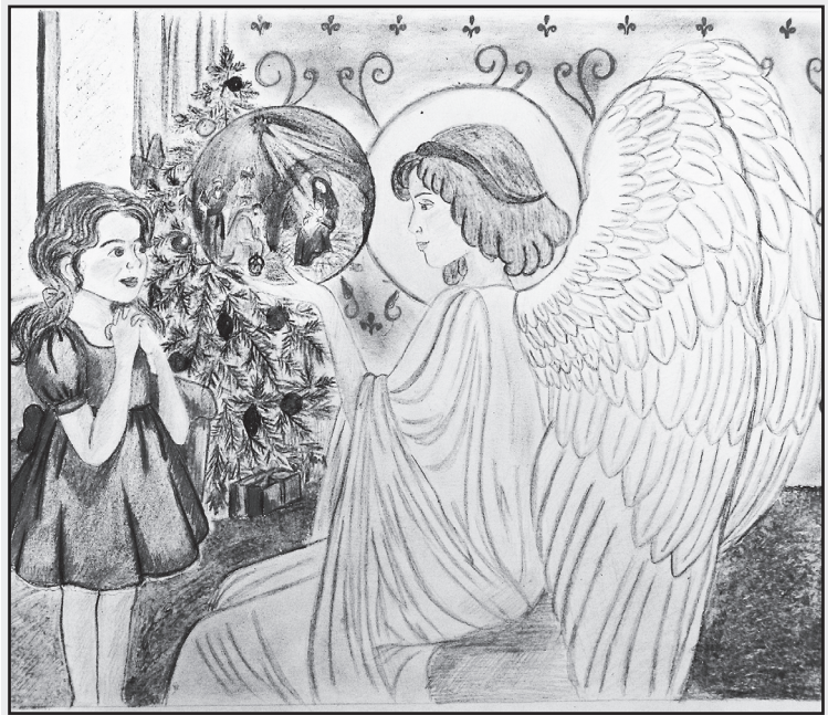
Рисунок Анастасии Семёновой, 10 лет