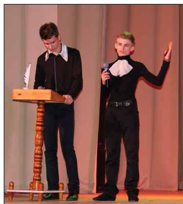
• В мир творчества Шекспира погрузили русаковские школьники.

– Работа жюри оказалась непростой. Подготовка конкурсанта прошла на высшем уровне. Выступления команд подарили много положительных эмоций и нам, и зрителям, за что им большое спасибо. При подведении итогов мы учитывали не только театральные постановки, но и многое другое: насколько в программе использовались материалы семейных архивов; исследовательская работа о земляках, на жизнь которых повлияло искусство; впечатление от прочитанных книг, просмотренных