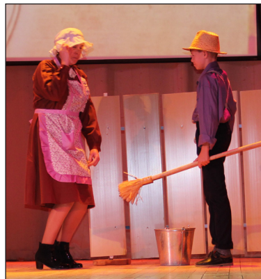
• Впечатлениями от книги Марка Твена «Приключения Тома Сойера» поделились ребята из Малиновки.