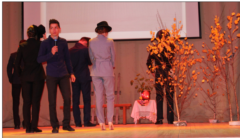
• Инсталляция ребят из Кротовского филиала была посвящена поэту-земляку В. Белову.

Заключительным выступлением стала программа «Талантами полна Аромашевская земля» команды школы райцентра . Через творчество жителей рай-