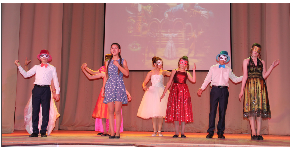
• «Театр не мода, вечен всегда... Всё волнением дышит – театр жизнь!»

Победители районного этапа конкурса представляют район в области. Пожелаем удачи нашим командам.