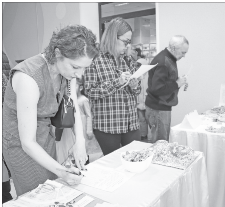
Работа жюри в номинации «Тайны семейного секрета».

Вряд ли смогу перечислить всех, кто подарил нам эту радость, потому что их много, и каждый со своей изюминкой, а все вместе они и создают историю нашего района.