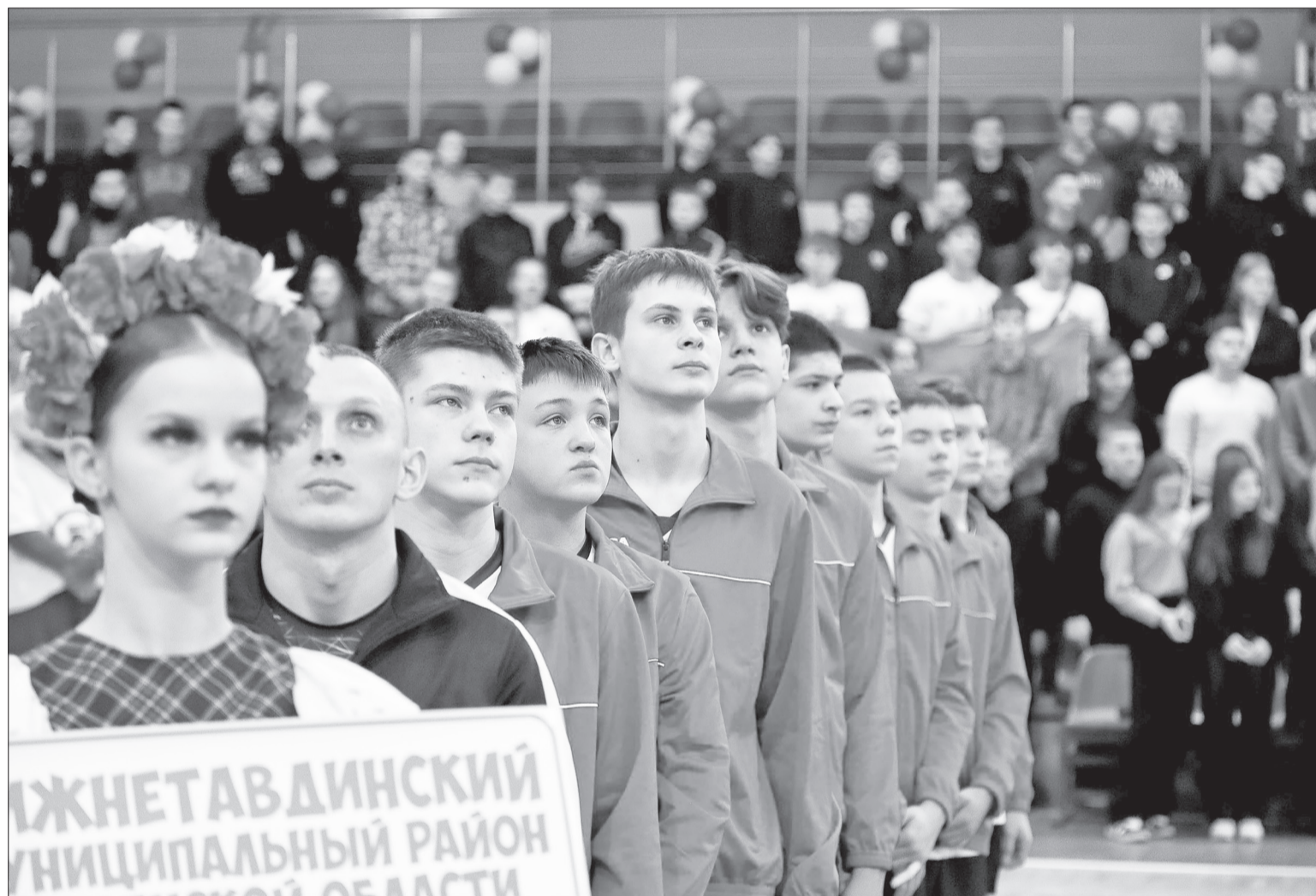
19 февраля, Борисов, Белоруссия. Делегация Нижнетавдинского района на церемонии открытия, предваряющей товарищеский матч с местным волейбольным клубом.

Историческая справка. Город Борисов – административный центр одноимённого района Минской области. Этот небольшой городок с населением чуть более 130 тысяч человек находится в 77 километрах от столицы Белоруссии на речке Березине, пра-