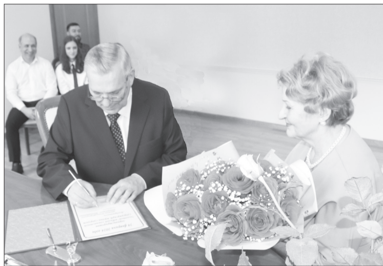
☑ Волнительный момент – через 50 лет вновь подпись в книге регистрации.