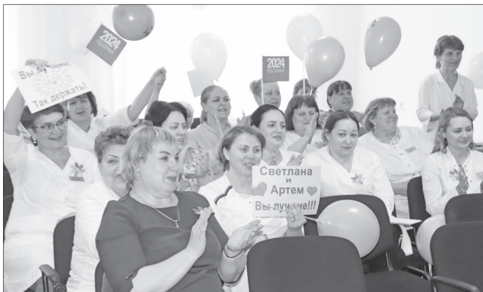
Горячая зрительская поддержка команд-участниц.