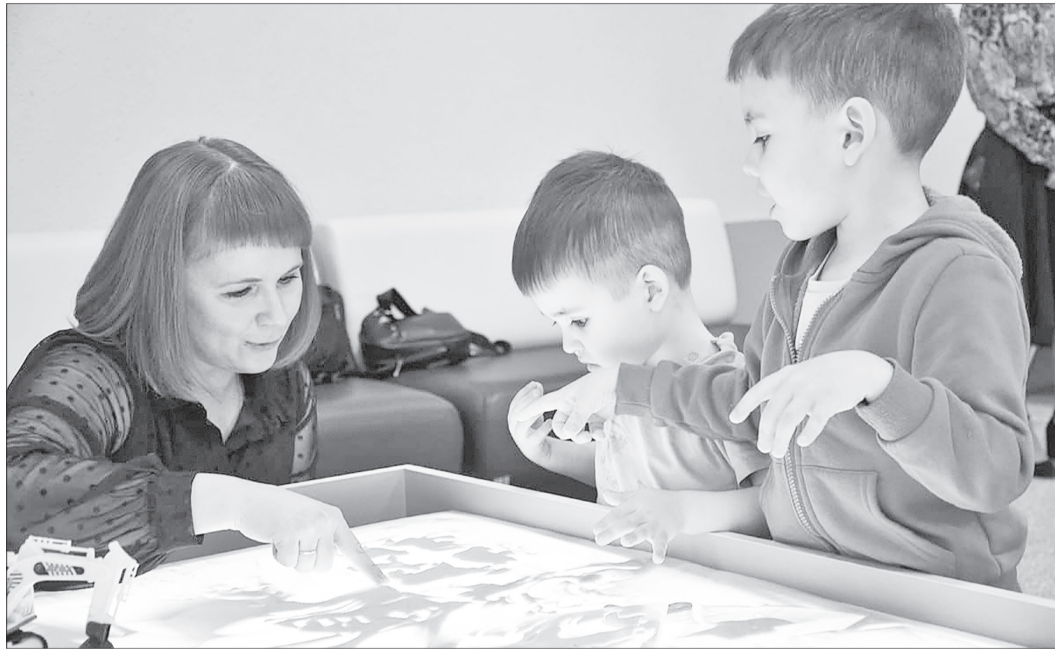
Местом притяжения деток стала площадка по рисованию песком.