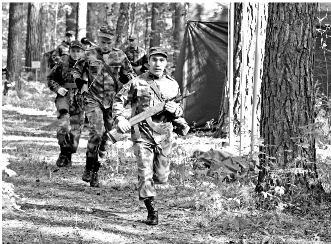
• В родном логу и сосны помогают! Курсанты падунской группы добровольной подготовки к военной службе «Гвардеец» выдвигаются на старт.

Военно-патриотический слёт «Недаром помнит вся Россия...» прошёл в городском округе