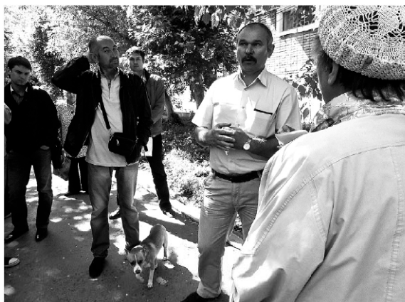
Услышит ли управляющая компания жителей?

История с этим двором длится уже почти полгода. Вначале, как говорят жители, в управе их успокоили и клятвенно заверили в том, что территорию обустроят только так, как они хотят. Те внесли изменения в проект, составили протокол, собрали подписи и начали ожидать решения властей. Что произошло дальше, совершенно не ясно: каждая сторона говорит что-то свое. Жители утверждают, что чиновники то не принимали, то терли их документы. В управе округа и управляющей ком-