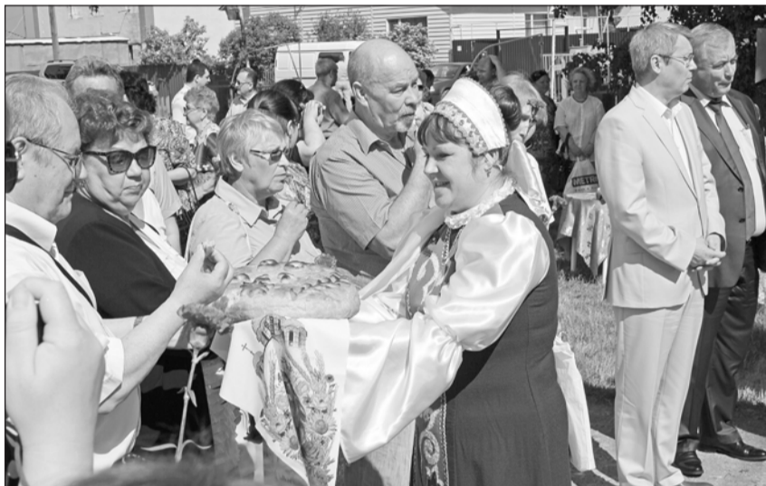
Журналистов встречали хлебом-солью