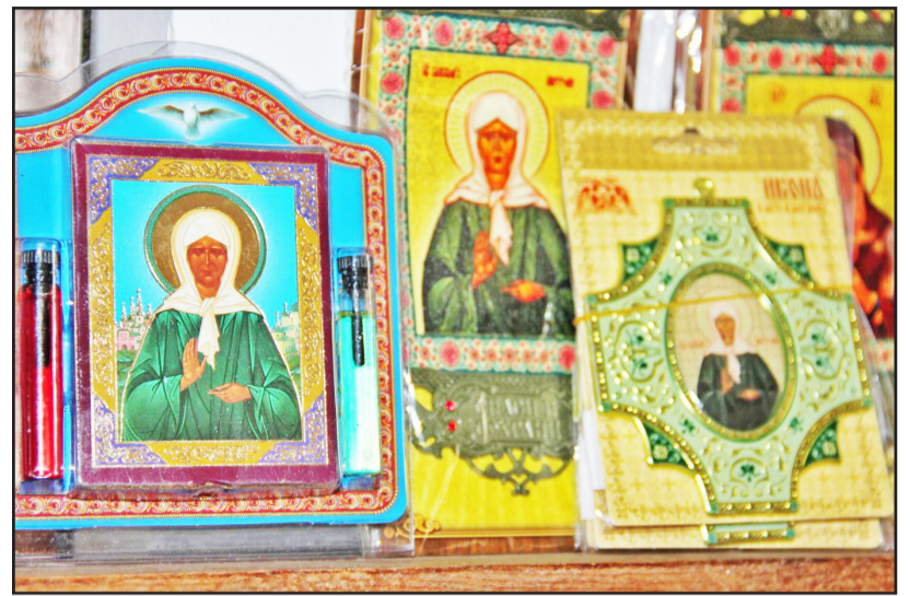
Иконы святой Матроны Московской в церковных лавках востребованы верующими почти наравне с образами Спасителя и Богородицы

«Все святые, когда видят, что мы молимся и не радеем, – скорбят, плачут и сетуют; когда же видят, что мы исправляемся и возрастаем в совершенстве, – радуются и в радости и веселии непрестанно изливают о нас к Создателю молитвы. И Господь тогда утешается добрыми делами нашими, равно и как свидетельствами и молитвами святых, и ущедряет нас всякими дарами» – учил преподобный Антоний Великий.