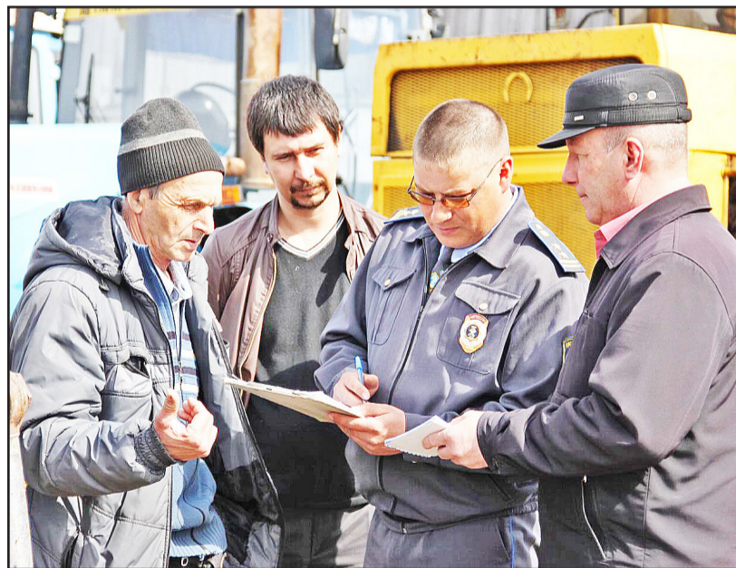
Обсуждение рабочих моментов по ходу техосмотра в СХПК им. Чапаева