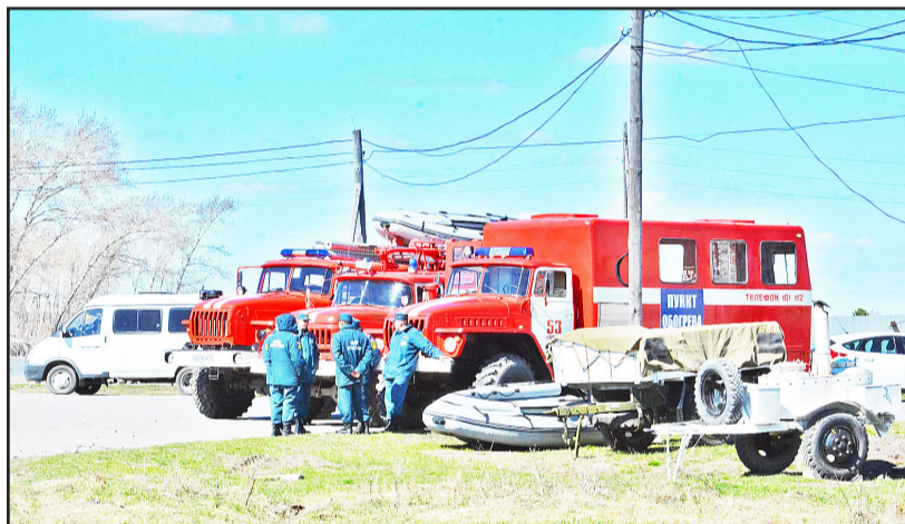
На помощь местным сотрудникам МЧС прибыли со всем необходимым снаряжением их коллеги из Ишима