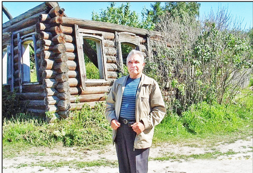
Остатки избышки, в которой мы жили во время войны. 2014 г.

Частенько вспоминается мне наша жизнь в военные годы в небольшой уральской деревеньке под названием Мостовая Свердловской области. Вот и хочу рассказать о том, как мы, ребяташки, жили в то время: в какой обстановке, в каком окружении, какие у нас были игры, как мы учились. Ведь, несмотря на глубокий тыл, жизнь и в сельской местности, как и по всей стране, была очень тяжёлой, потому что всё было подчинено призыву: «Всё – для фронта, всё – для победы!»