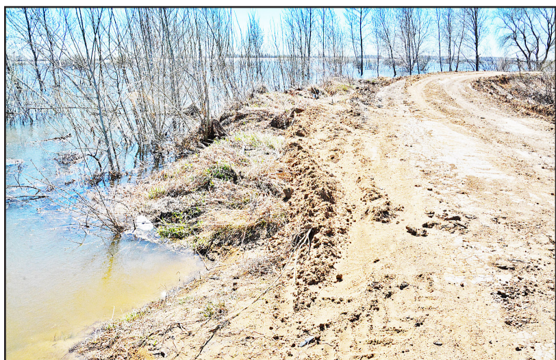
Дамба в начале улицы Советской райцентра пока держит натиск воды