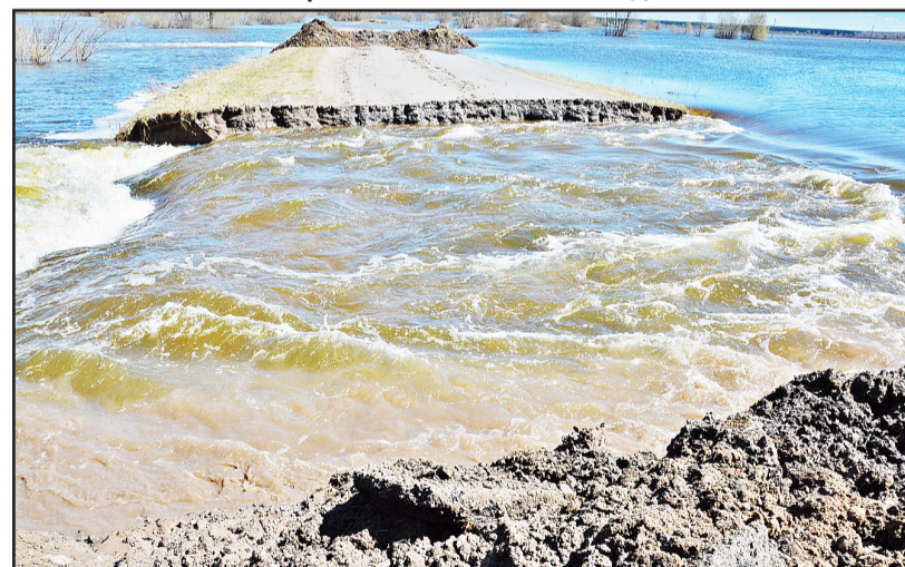
Путём вскрытия дорожного полотна на автодороге Казанское – Копотилово снижен уровень воды в районе ул. Советской