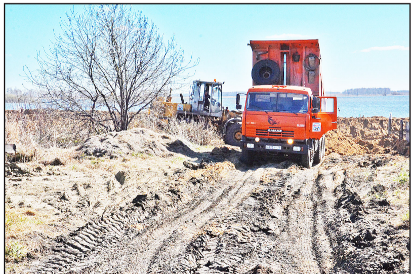
Работники дорожной службы уже который день не прекращают работы по отсыпке дамбы