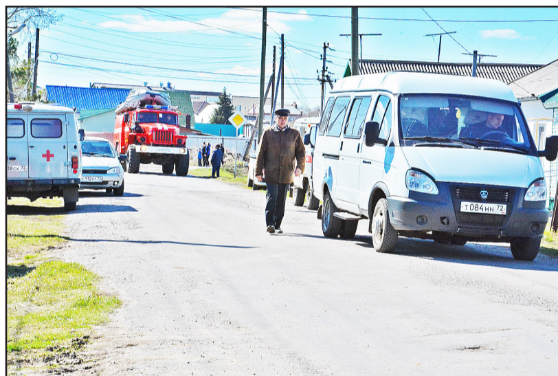
В полной боевой готовности – все службы района, призванные помогать людям