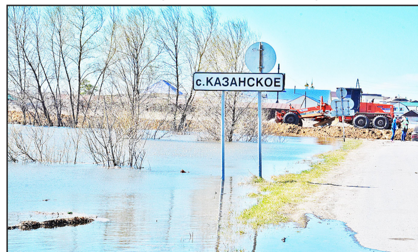
Жителям Пешнёвской территории пока нет возможности добраться до райцентра