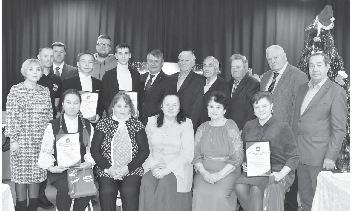
Встреча почётных граждан и молодёжи завершилась совместной фотографией

Одна из новогодних традиций, которые в Ярково соблюдают каждый год – встреча почётных граждан района. 2022-й не стал исключением: 21 декабря в конференц-зале Янковской центральной библиотеки собрались ярковчане, снискавшие уважение и почёт односельчан, внёсшие большой вклад в развитие экономики и социальной сферы района и достойные стать ярким примером для молодёжи.