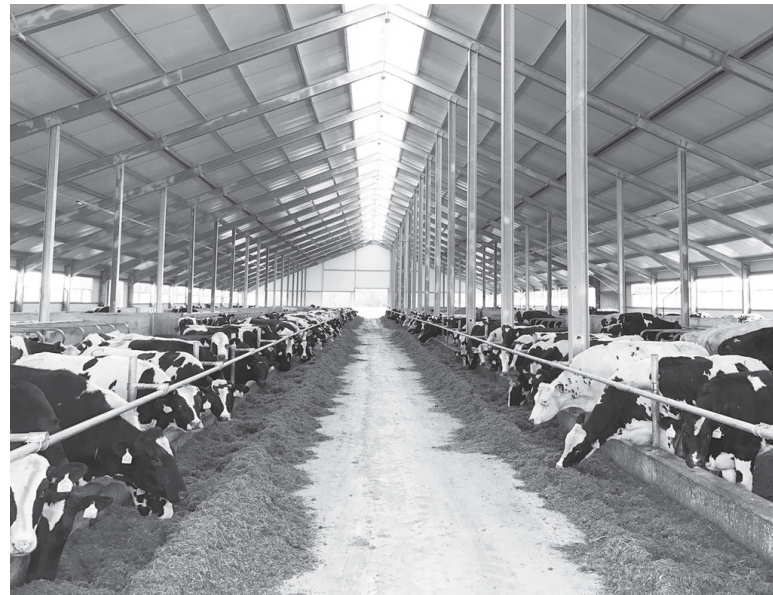
В «Плеханово» содержится более 3500 голов КРС

Агрофирма «Междуречье», входящая в группу компаний «ЭкоНива», пятнадцать лет успешно работает в Тюменской области. История компании в регионе началась с 4900 гектаров земли и старой молочной фермы. Сегодня ООО «Агрофирма «Междуречье» – современное предприятие, работающее на 6700 гектарах земли в Янковском районе. В его состав входит животноводческий комплекс «Плеханово»: по технологии беспривязного содержания здесь содержится свыше 3500 голов крупного рогатого скота, больше половины из которых – фуражные коровы. Также под управлением агрофирмы работает молочно-товарная ферма «Гилёво» с общим поголовьем 590 животных.