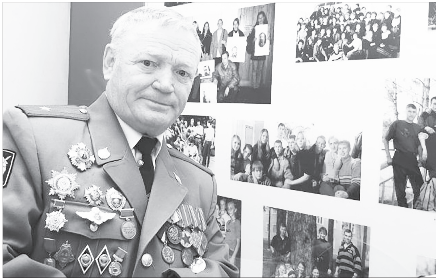
Геннадий Александрович был единственным в Тюменской области обладателем ордена Благоверного царевича Димитрия, Московского и Угличского чудотворца