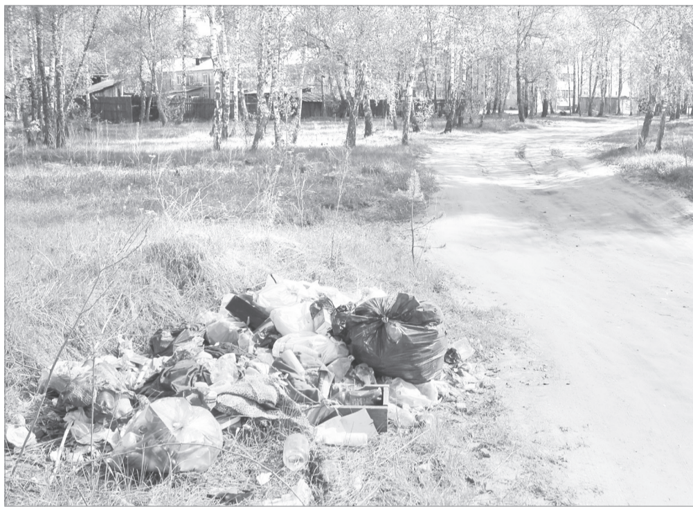
Даже при свободном доступе к полигону ялуторовчане превратили проход между улицами Менделеева и Дзержинского в свалку

Анатолий МЯСНИКОВ