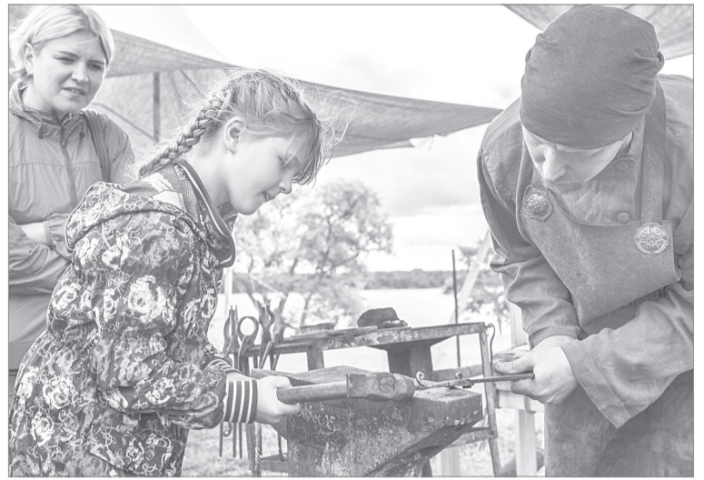
Уже в эту субботу все желающие смогут овладеть секретами кузнечного мастерства