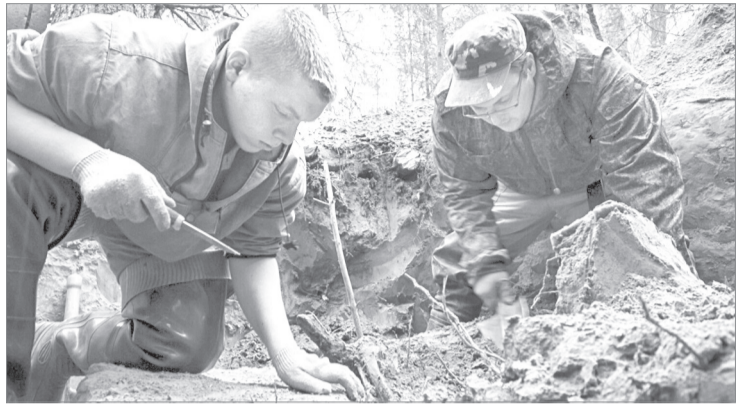
Главное в работе поисковиков - не повредить найденные останки и вещи бойцов

Поисковый отряд Ялуторовского района «Салют Победы» вернулся из экспедиции «Вахта Памяти-2017».