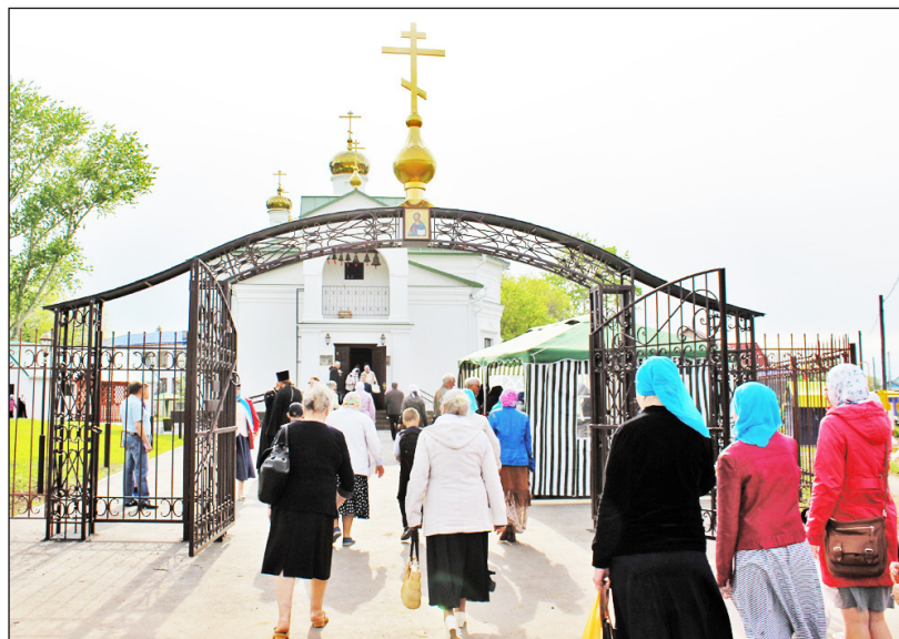
Новый храм – украшение села Ершово

(примерно таком же по объёму, как у нас в казанской церкви) храмовом пространстве скопилось и немало верующих мирян. А за стенами храма тоже кипела жизнь.