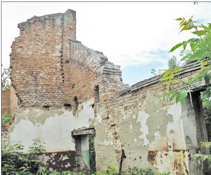
Это всё, что осталось от МТМ в Пешнёво. 2018 г.