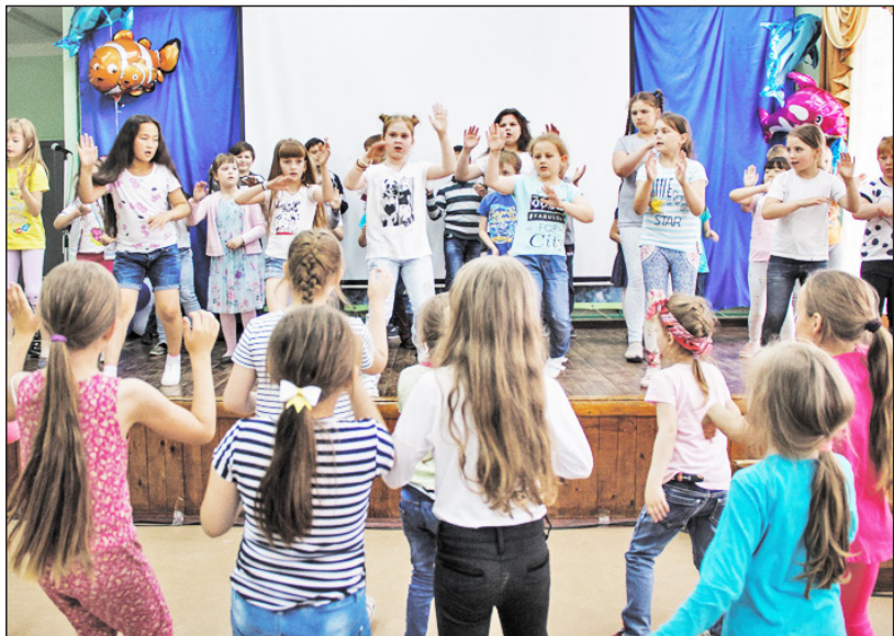
Дети с удовольствием танцевали под песню Тимати «Лада седан»