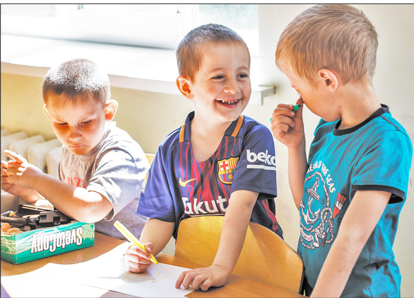
Мальчишки советовались, что лучше нарисовать