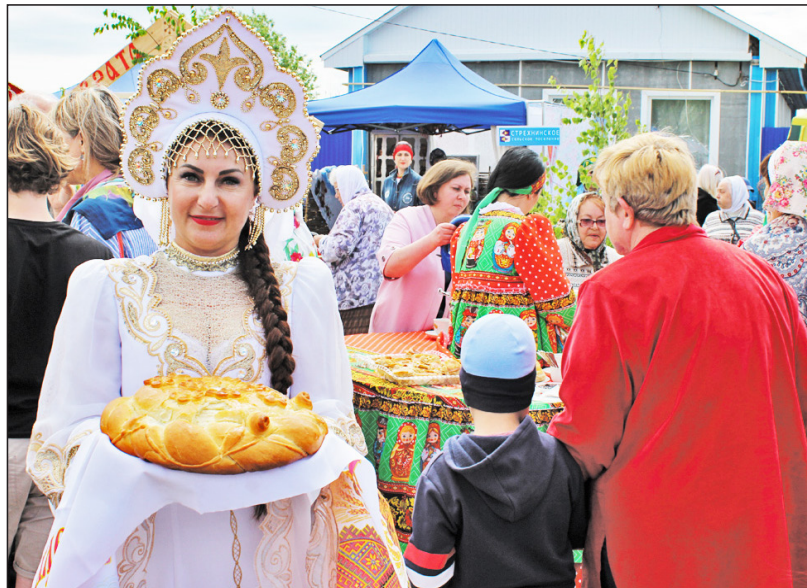
По русскому обычаю и хлебосольству гостей праздника угощали пышным караваем