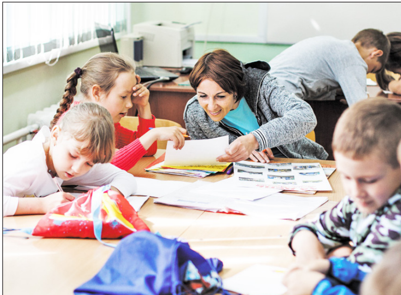
Хорошо, когда рядом есть добрый наставник

Пока ребята были на улице, я решила пройтись по коридорам или, вернее сказать, по улицам лагеря. С учебного года остались на стенах фотографии в разноцветных деревянных рамках: вот мальчик в больших очках держит на руках пушистого серого кота, а на его плече сидит морская свинка, вот девочка возле комнатного вьющегося растения, в листьях которого спрятался попугай, а вот парнишка уверенно сидит верхом на коне. Пройдя дальше по «улице», я увидела множество детских рисунков. На них были изображены мужчины. Сверху надпись: «Быть похо-