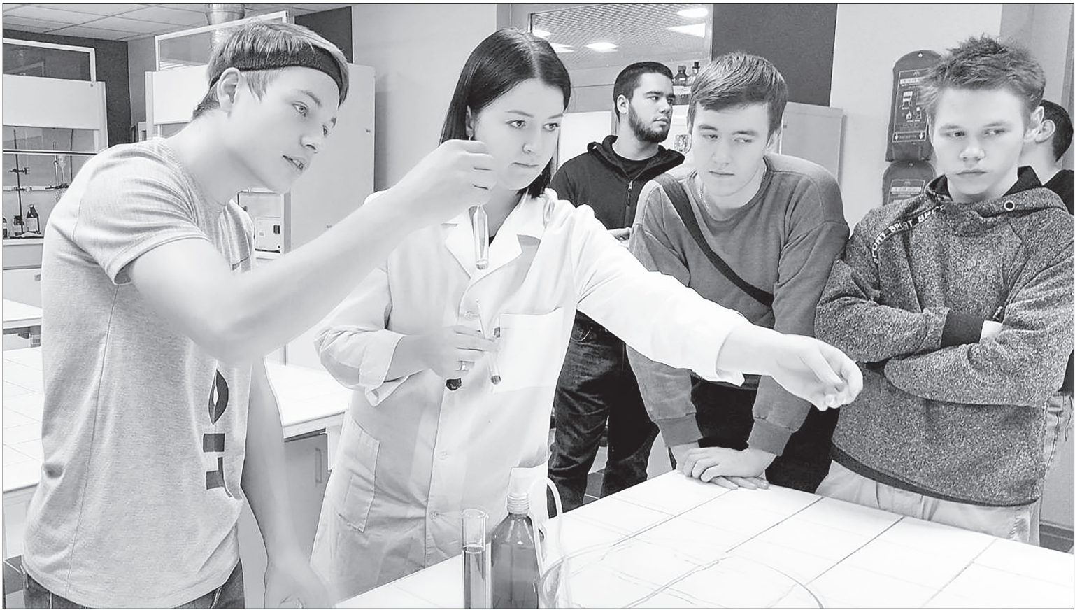
Студенты на практике знакомились с будущими профессиями, которым обучают в Тюменском индустриальном университете.

С праздником! Александр Моор – губернатор Тюменской области