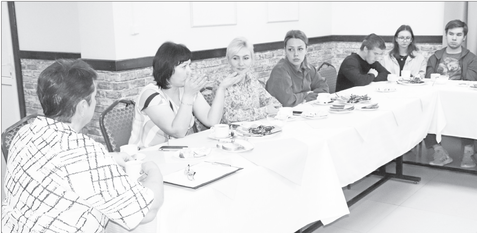
Встреча будущих поваров с потенциальными работодателями.

Один день из жизни Агротехнологического колледжа