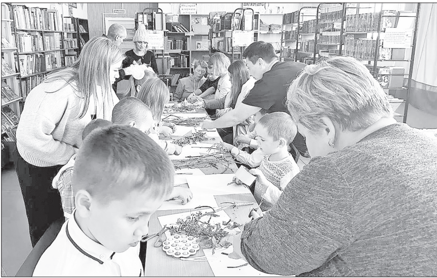
Семейный выходной в Черепановской библиотеке.