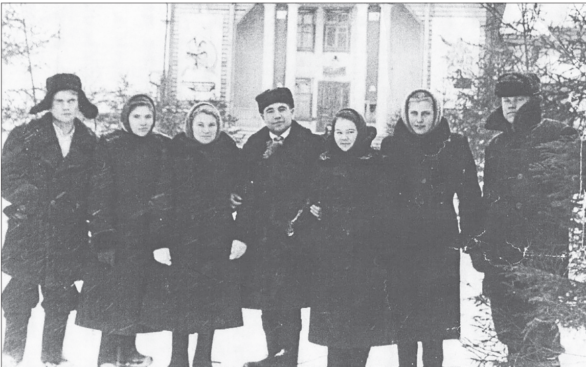
Комсомольцы Нижнетавдинского района 1950-60гг. Строители парка культуры и отдыха. Фотография с выставки.

Следующая остановка – Канашский сельский Дом культуры. Здешних зрителей посетили гости из Нижней Тавды.