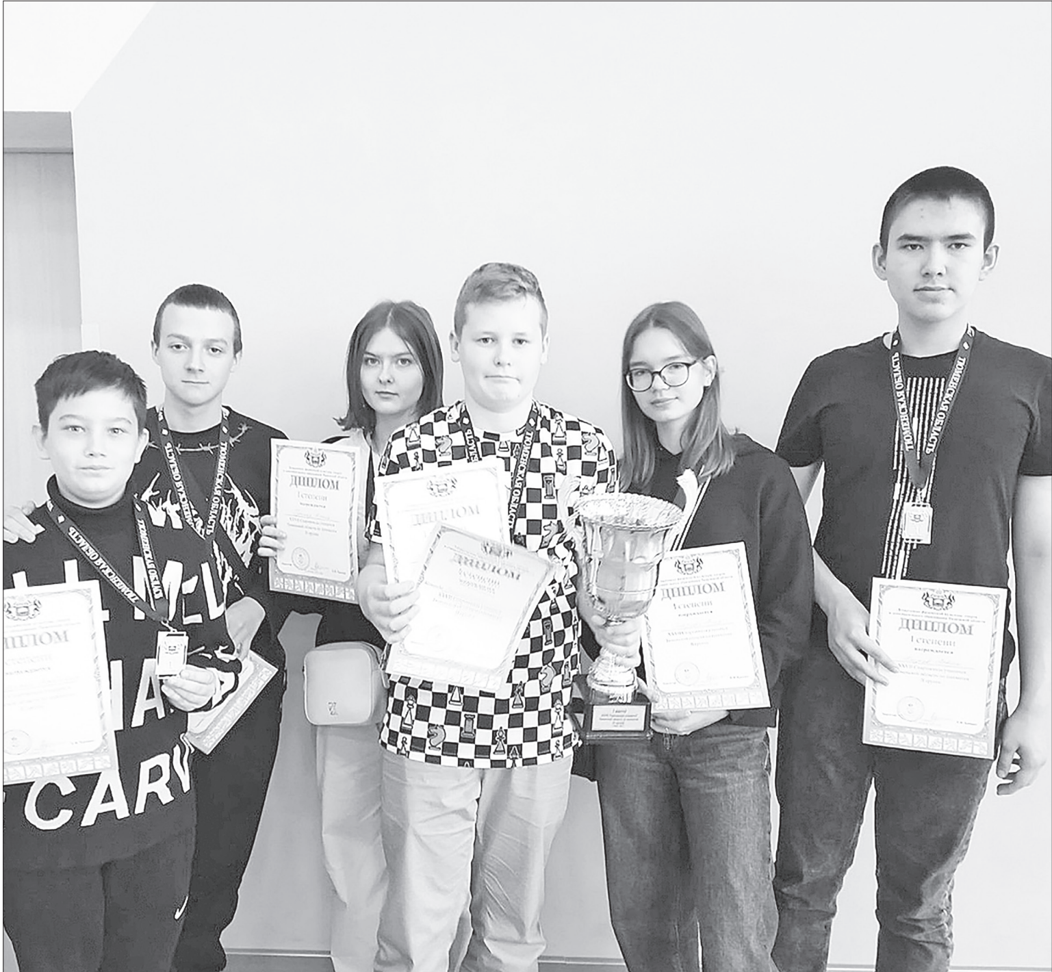
📷 Сборная команда Нижнетавдинского района по шахматам победой закончила соревнования по шахматам в рамках спартакиады учащихся Тюменской области.

По итогам состязаний третье место заняли голышмановцы. Второе – у ярковцев, а победа заслуженно досталась воспитанникам Нижнетавдинской спортивной школы. Интересно, что в прошлом году на пьедестале оказались те же самые команды, но совершенно в другом порядке, а у наших ребят были только бронзовые награды.