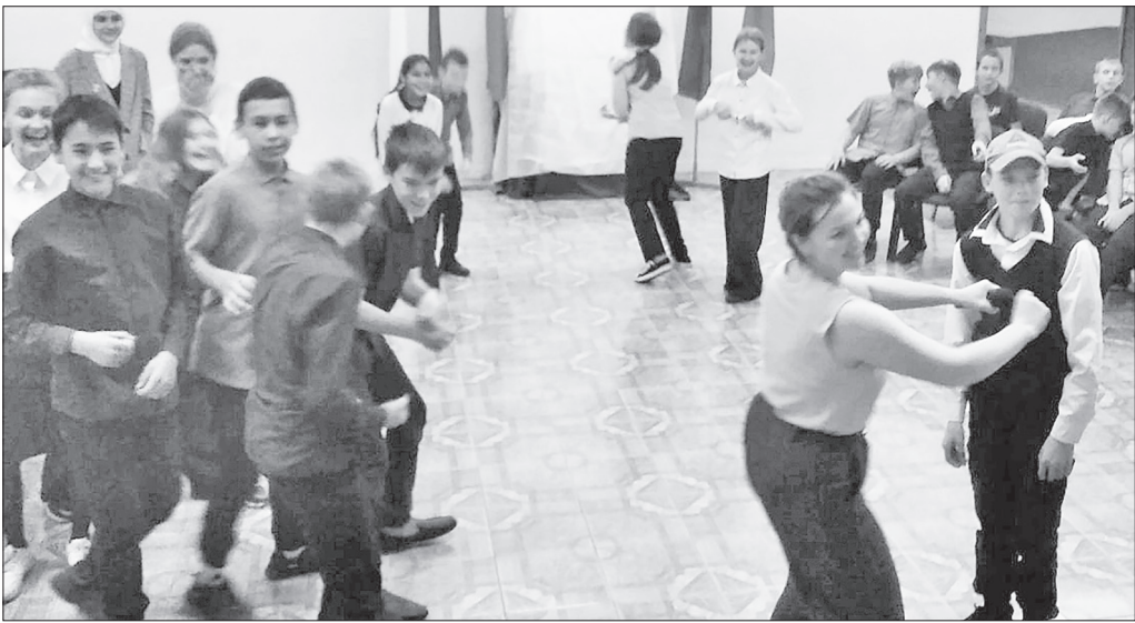
Весёлые фанты в исполнении искинских и велижанских ребятишек.