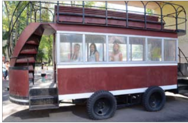
В павильонах «Мосфильма»

«Маршруты Победы» - так называются образовательные краеведческие экскурсионные поездки, которые были разработаны ещё несколько лет назад в рамках Национальной программы детского культурно-познавательного туризма, реализуемой Министерством культуры РФ. Организованы они были для приобщения молодёжи к истории и культуре России, гражданско-патриотического воспитания подрастающего поколения, поощрения и поддержки талантливой молодёжи. Ведь стать участниками поездки могли одарённые дети, победители районных и областных олимпиад, слётов, соревнований, творческие