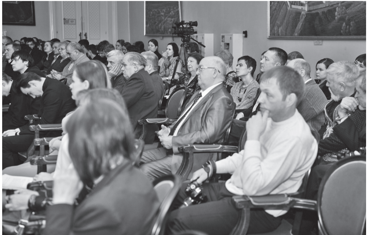
На презентации книги о фронтовиках-журналистах области

проработавший в «районке» ее редактором, ответственным секретарем. Участвовал в боях на Курской дуге, форсировал Днепр, освобождал Киев. В должности командира самоходной артиллерийской установки с боями двигался по территории Германии, Чехословакии, служил в Австрии. Был контужен, ослеп на один глаз. Награждался боевыми орденами и медалями.