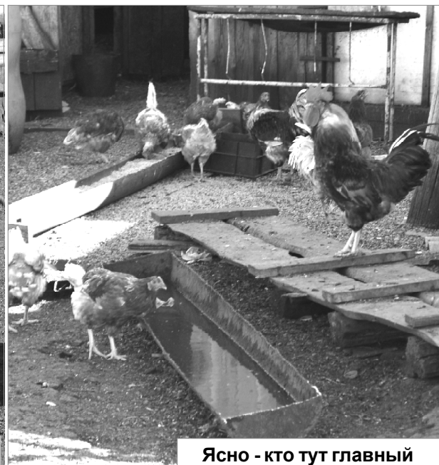
Ясно - кто тут главный