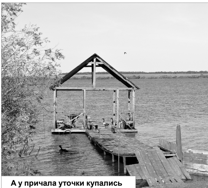
А у причала утки купались