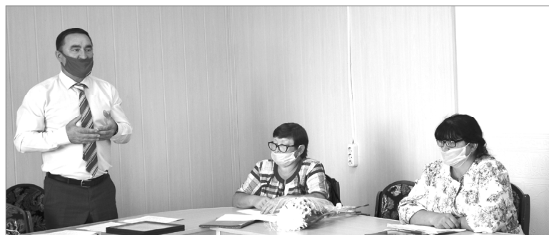
Глава района обозначил задачи на текущий период