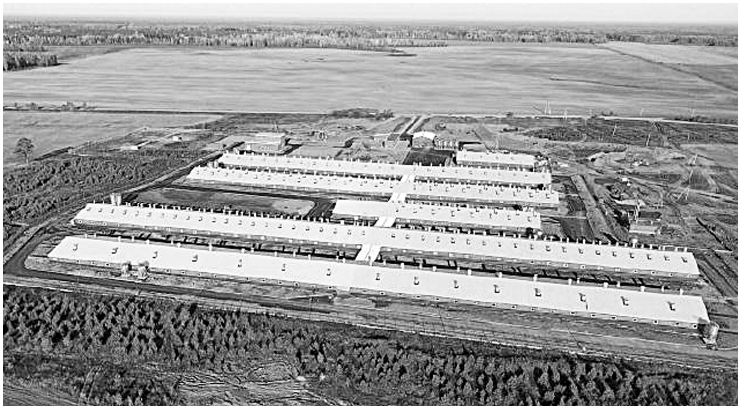
Свинокомплекс «Тюменский». Вид с высоты птичьего полёта.