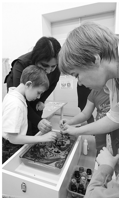
Акваанимация интересна и детям, и взрослым.

Нужно отметить, что дополнительные платные услуги пользуются большим спросом у родителей и успехом у детей. И совсем не страшно, что подчас мотивация ребёнка неустойчива, что его интересы часто меняются. В конечном итоге каждый находит занятие по душе и делает свой личный выбор. Значительно важнее, что создание условий, которые позволяют сделать собственный выбор, способствует социально-личностному развитию детей. Родители понимают важность укрепления здоровья, необходимость творческого развития ребёнка, социальную готовность к обучению в школе, соответственно, заказывают и услуги. У наших педагогов не утрачен творческий потенциал, стремление к самостоятельному поиску новых форм и методов работы. Их авторские находки