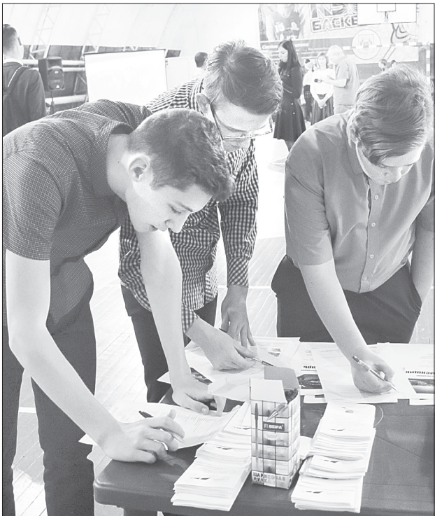
О каждой профессии более подробно ребята узнали из буклетов

На ярмарке посетителям раздали буклеты: «Выбираем правильный путь», «Как правильно выбрать профессию», «Информационная поддержка профориентации интернет-ресурсами», «Выпускникам школ», «Ступени принятия решений», после ознакомления с которыми ребята задавали представите-