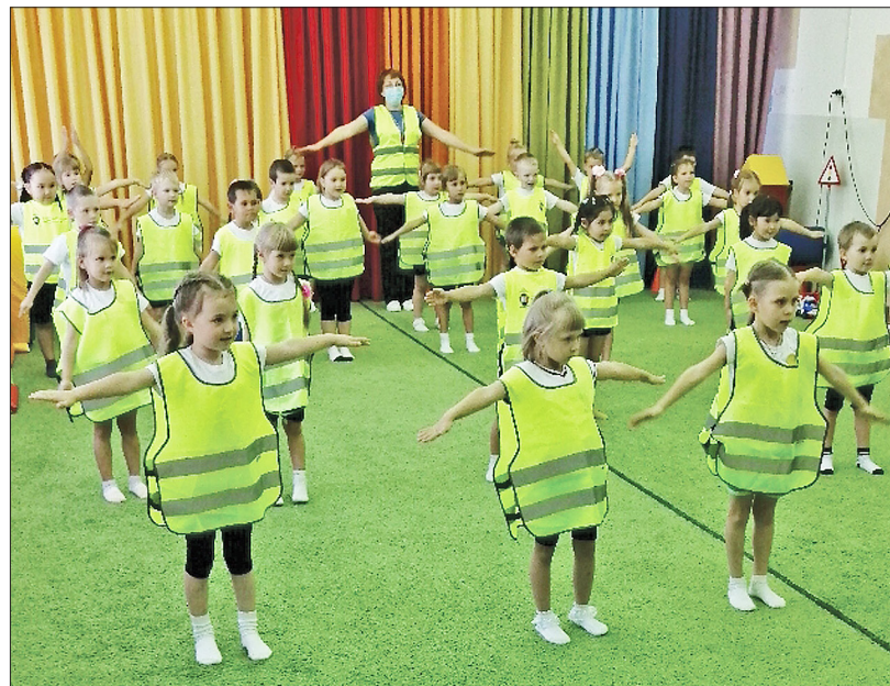
Дошкольники с удовольствием участвовали в тематическом флэшмобе

Ежегодно в стране увеличивается количество автомобильного транспорта, и его движение становится всё более интенсивным. Именно поэтому обучение дошкольников правилам безопасности дорожного движения – одна из важнейших задач взрослых.