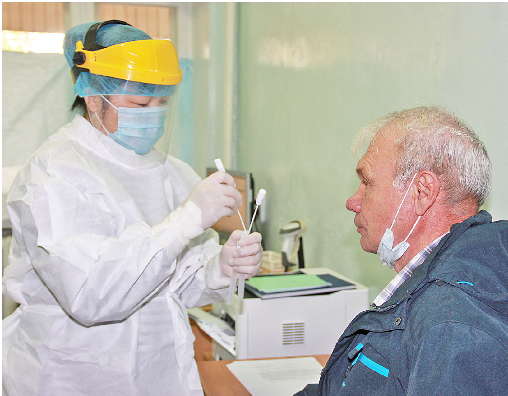
Сделать тест на COVID-19 можно только по направлению врача. Пробы для анализа берутся медсестрой поликлиники