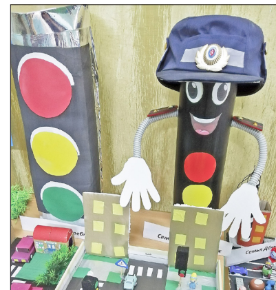
Светофор в виде полицейского, макеты улиц и другие поделки можно было увидеть на выставке по безопасности дорожного движения

Воодушевлённые дошкольники участвовали в увлекательных конкурсах и эстафетах. Завер-