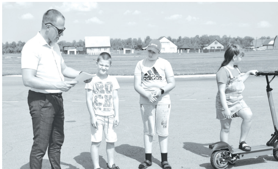
Подружки с интересом осваивают современный двухколёсный транспорт.

Сегодня каждый родитель переживает за своего ребёнка, ведь пока он на работе, дети предоставлены сами себе. Катаются на велосипедах или самокатах и зачастую не знают и не соблюдают Правила дорожного движения.