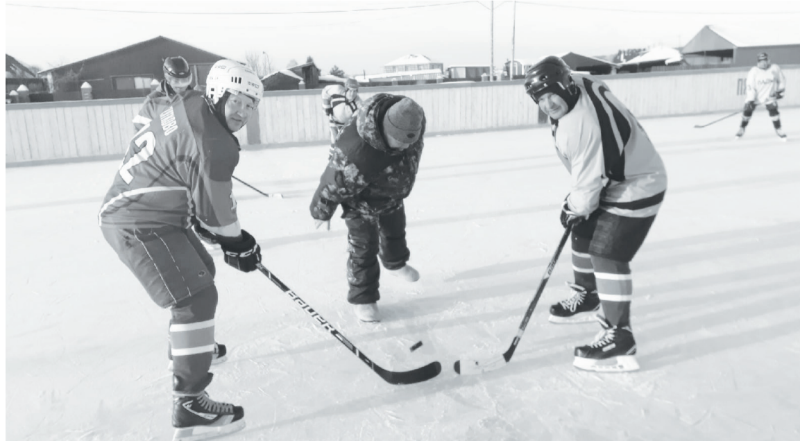
Начинается борьба за шайбу.

Заявки из сельских поселений по ремонту спортивных сооружений поступают регулярно. В Ингалинском подготовлено и огорожено место под строительство стадиона с футбольным полем, волейбольной и баскетбольной площадками. Пока средств на большую стройку нет, поэтому решение вопроса отложено, зато в июне 2022 года в селе открыли тренажёрный зал. Муниципальное здание было передано на баланс нашей организации. Мы провели там ремонт, который обошёлся в 230 тысяч рублей, теперь ищем возможность для трудоустройства инструктора тренажёрного зала и надеемся,