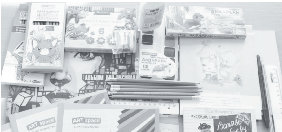
Упоровцы приготовили подарки для первоклассников.