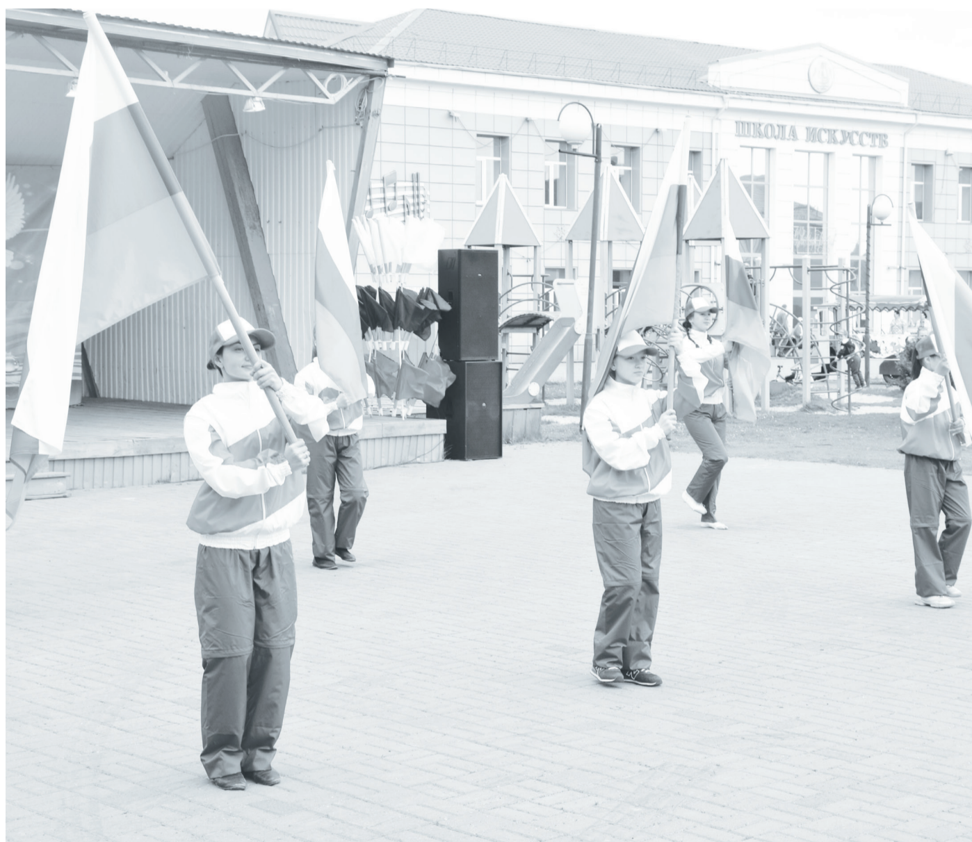
Российский триколор придаёт особую торжественность любому мероприятию.

Это один из официальных праздников нашей страны. Он установлен в 1994 году указом президента РФ и посвящён возрождённому флагу России – «национальному триколору».