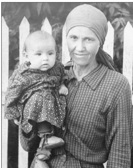
Народ России не расплещет память И пронесёт её через года. Победной битвы сохраним мы знамя, И подвиг павших не забудем никогда.