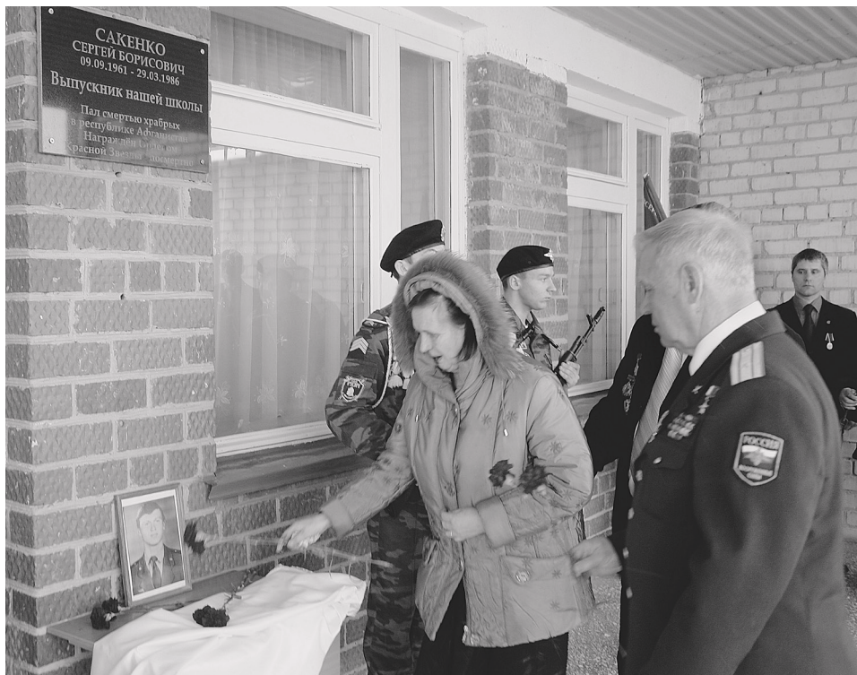
Открытие мемориальной доски в д.Новоандреевка. Декабрь 2010 г.