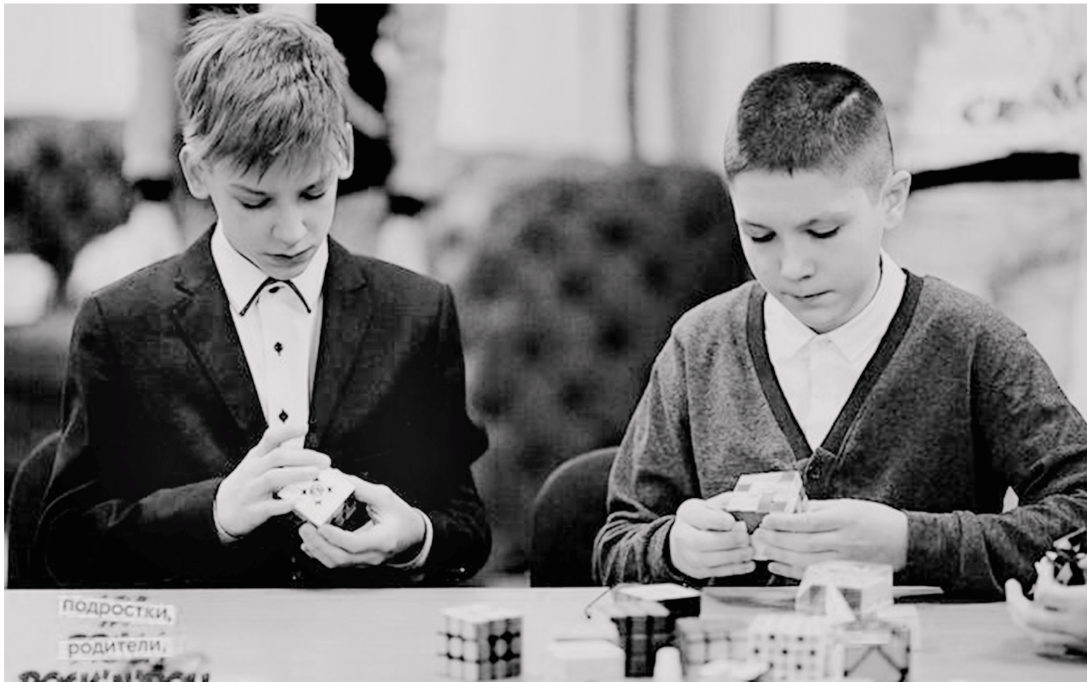
На областном форуме работали площадки по разным актуальным темам.