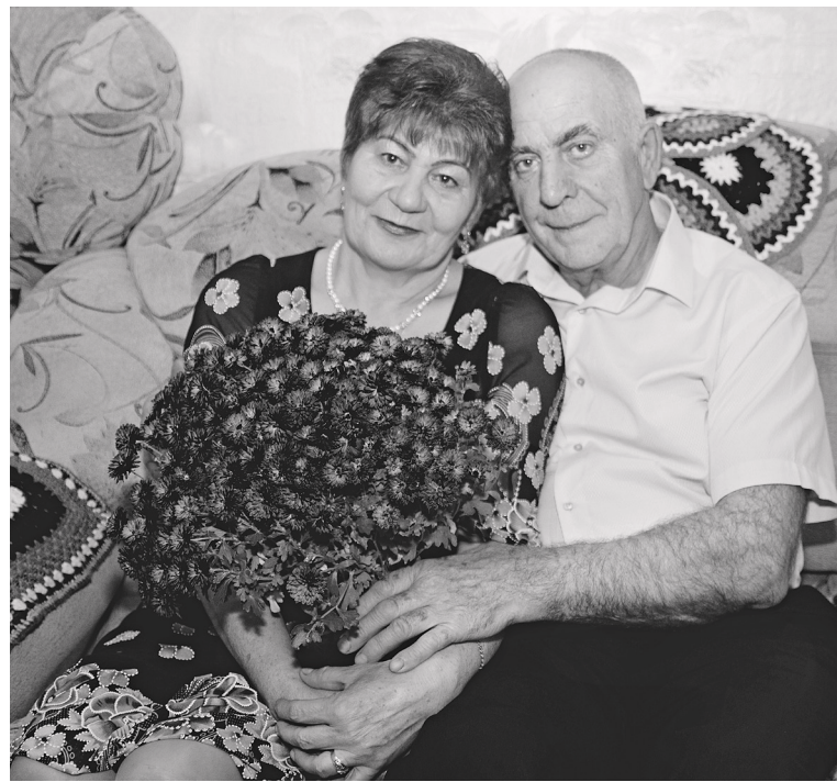
Супруги Швецовы с годами ценят друг друга всё больше.