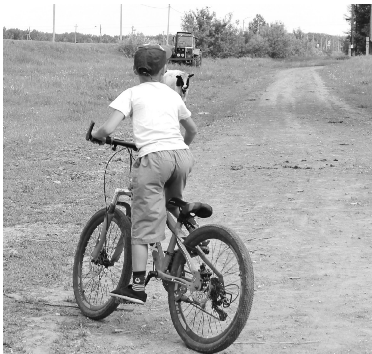
Каждый велосипедист должен внимательно относиться к своему транспорту и не оставлять его без присмотра

В ходе проведения оперативно-розыскных мероприятий сотрудники уголовного