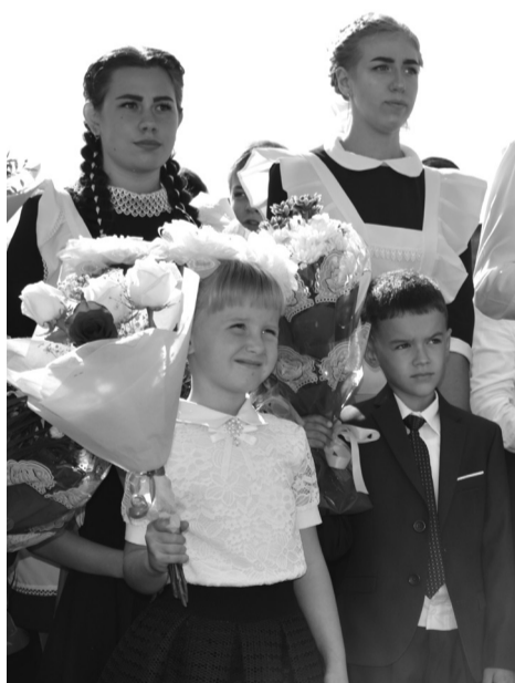
Настоящих линеек ждут все – особенно выпускники и первоклассники

Перехода на дистанционное обучение на постоянной основе не планируется.