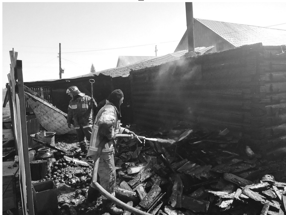
Сорокинские огнеборцы на тушении пожара

Соблюдайте элементарные правила пожарной безопасности. Не