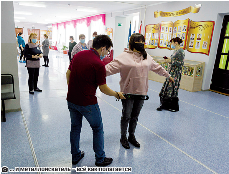
и металлоискатель – всё как полагается

В этом году в качестве постановки решили взять историю жизни жительницы села Байкалово, которая в годы войны находилась с мамой в Германии, прошла через концлагеря. Материал приходится добывать по крупицам, помогают в этом школьный библиотекарь, социальный педагог, музей. Премьера спектакля планируется к 9 Мая. Но тема очень