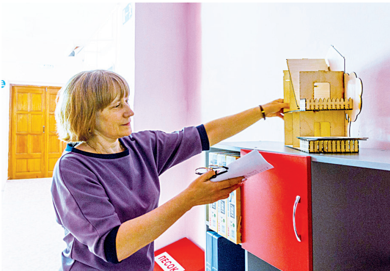
Кабинет технологии притягивает увлечённых конструированием

Конечно, новый кабинет – это новые возможности и условия для изучения предмета. В этом байкаловцы уже убедились на примере центра «Точка роста», который открылся на базе школы в сентябре 2019 года. Кабинеты информатики, химии и биологии, оснащённые новейшим оборудованием, дали новый толчок педагогам в учебном процессе. Кроме того, коллектив успешно и плодотворно реализует сетевое сотрудничество. За этот период через площадки прошли практически все школы района, в планах на апрель Бизинская школа. Специалисты центра составили описание занятий, разработали