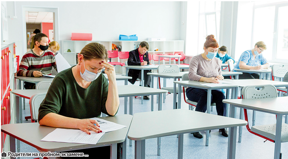
Родители на пробном экзамене