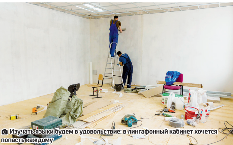
Изучать языки будем с удовольствием: в лингфонный кабинет хочется попасть каждому